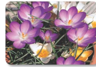
クロッカスが早春の陽をうけて花開き、春の訪れを感じます。アヤメ科の球根植物。