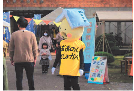
「おとしょちゃん」の着ぐるみ 大野市図書館まつり

また、大野市図書館における子どもの読書活動を推進するために、司書の専門的な研修が必要です。