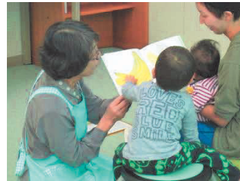
ブックスタートの様子

大野市図書館は、ブックスタートをはじめ乳幼児を対象とした事業を実施しています。家庭における読書の大切さを理解してもらうためにも、事業を継続して行う必要があります。