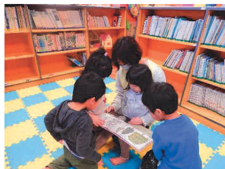
園での読み聞かせの様子

乳幼児期に絵本や物語の楽しさを味わい、さまざまな本との出会いの機会をつくるため、園は、毎日絵本の読み聞かせや紙芝居などを行っています。また、年齢に応じた図書コーナーを設けて、子どもが自由に絵本を手にとって見ることができる居心地のよい場所となるように環境を整えています。