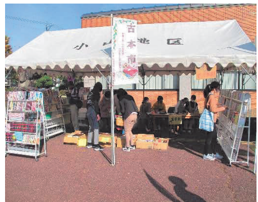
「図書館部」による古本市 大野市図書館まつり

大人に対しては、子どもに質の高い本を届けるために絵本について学ぶ「絵本の部屋」や講演会を開催するなど、研修の機会を提供しています。乳幼児や児童生徒に対する読み聞かせ技術の向上や内容の充実を目的として、平成21年度から「絵本読み聞かせボランティア養成講座」を開催し、読み聞かせができるボランティアの育成を図っています。令和3年度には、63名が登録しており、大野市図書館での「読み聞かせ会」や「ブックスタート」、保育所や認定こども園、学校などで読み聞かせボランティアとして活動しています。