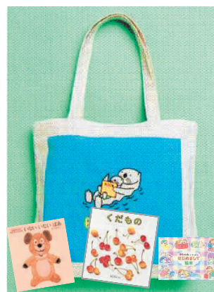
ブックスタートでプレゼント

また、保育所や認定こども園、小学校、児童センターでの読み聞かせ(※3)も定期的に行われ、読み聞かせボランティアの活動も活発に行われるようになりました。そのほか、「メディアコントロールチャレンジ」(※4)などデジタルメディア機器の使用に対する取り組みについても、子どもの年齢に応じて実施しています。