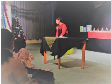
「おはなし会」 大野市図書館クリスマス会

子どもたちにとって図書館は、豊富な蔵書の中から読みたい本を自由に選び、読書の楽しみを知ることができる場所であるとともに、保護者にとっても子どもと一緒に本を選んだり、司書に相談をする場所です。