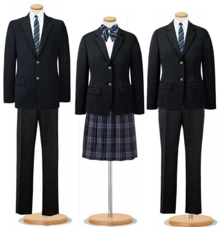
ズボンとスカートは冬夏兼用です

水の町として知られた大野。 名水百選にも選ばれた御清水の清らかな水をイメージした「青」をキーカラーとしました。 若々しさを感じさせる青は中学生にピッタリのカラーです。