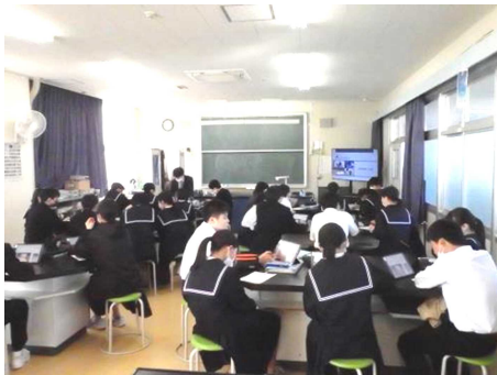
【開成中学校での交流の様子】