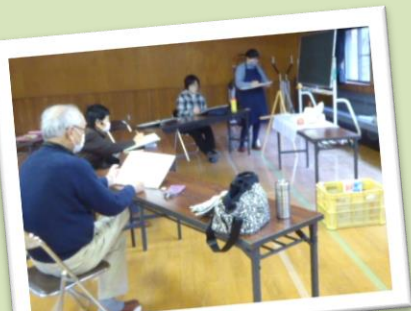
↑ 水彩画教室の様子