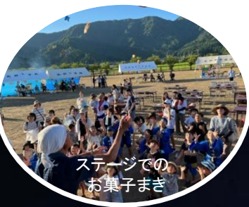
ステージでのお菓子まき

8月5日(土)、4年ぶりに「いぬいかわ夏まつり」を旧乾側小学校グラウンドで開催しました。ステージ周辺や模擬店は笑顔であふれ、景品をグレードアップした抽選会も盛り上がり、会場は多くの人で賑わいました。また、4年ぶりの開催を祝して打ち上げた記念花火は、大きな歓声に包まれ、乾側地区が一つになって熱く盛り上がった1日となりました。