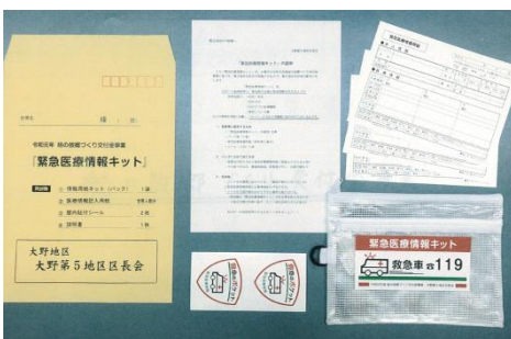
緊急医療情報キット

第5地区では、救急搬送や避難など緊急時に役立つ情報をまとめた「命のポケット」を各世帯に備える事業を行いました。情報記入用紙に緊急連絡先や既往歴、アレルギーなどの救命に対応する情報をキットに納め、到着時の救急救命士などが目につきやすい冷蔵庫などへ磁石等で貼り付けておき、救急搬送時に役立てようというものです。9月19日に説明会を開催され、キットが配布されました。