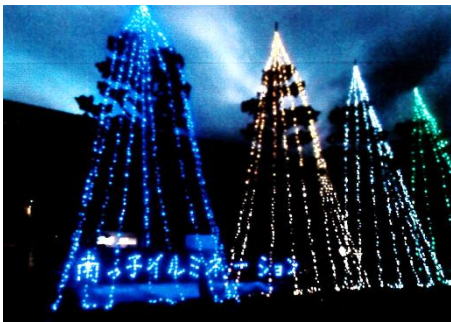
南っ子イルミネーション

第1地区では、有終南小学校の周囲をイルミネーションで飾りにぎわいを創出する事業を行いました。学校西側の道路に面したフェンスを電飾で飾り付け、正面玄関前の植え込みまで規模を拡大し、フェンスから一連となって電飾を飾り付けることとしました。東京オリンピックに合わせ、そのロゴマークを配するなどの工夫を行い、10月14日から点灯を開始して、12月25日までを点灯期間としました。