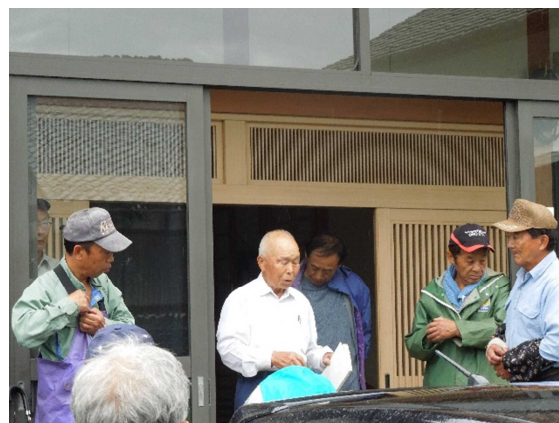
【舌城・茶臼山城跡遊歩道草刈り・樹木伐採】