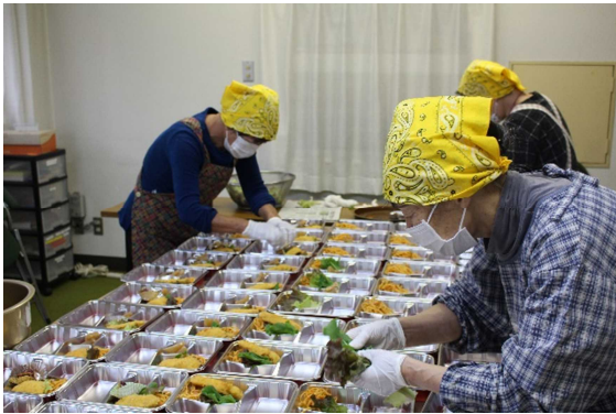
【毎回55食分のお弁当を作っています】