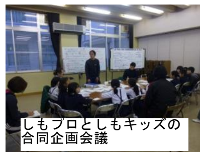
しもプロとしもキッズの合同企画会議