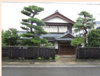
入口は本町通り側にあります。 (所在: 明倫町3-42)