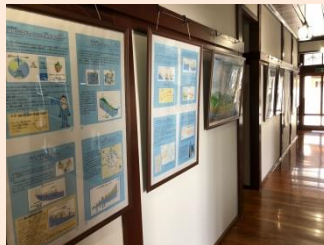
地下水に関する研究成果や保全活動をパネルで紹介しています。