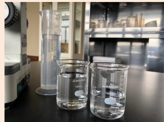
実験器具を備えた研究室を設け、フィールドワークの拠点として活用しています。