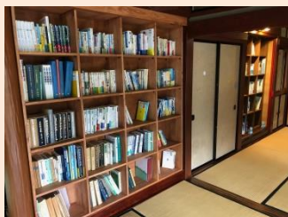
水に関する資料や専門書などを自由に見ることができます。