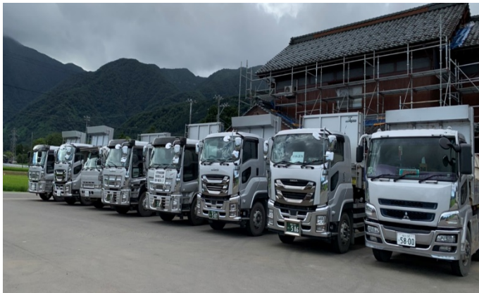
【大型ダンプトラック】