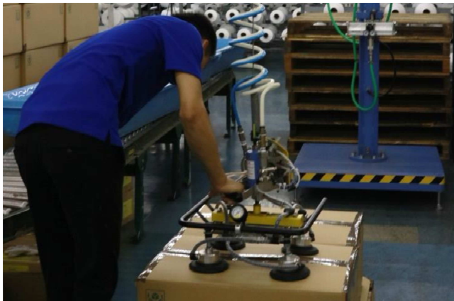
【60Kgの製品を持ち上げられる機械】