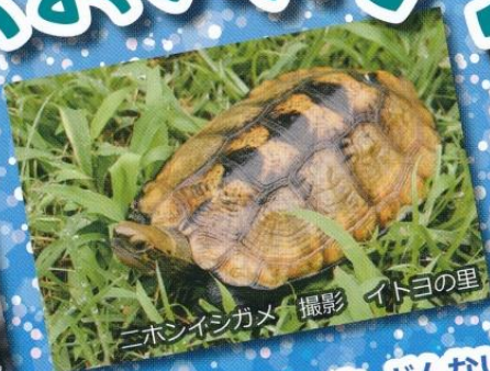
ニホンイシガメ