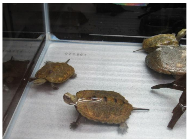
生体展示「今日のいきもの」コーナーで現在展示中のアカハライモリ・ニホンイシガメ