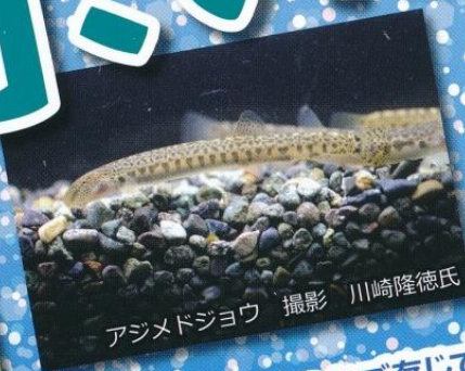
アジメドジョウ