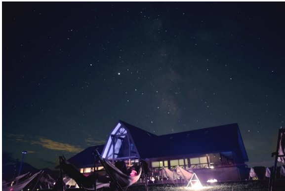
福井県大野市の体験イベント「星空ハンモック」