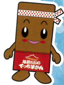
イメージキャラクター でかてちくん

“越前おおの”の名水で作りにあげた「越前おおのでっち羊かん」は、名水の持つ柔らかくほんのり甘い味わいと、小豆と黒砂糖の深い風味を封じ込め、格別の味わいがあります。つるっとした口当たりと、昔ながらの味わいをぜひご賞味ください。