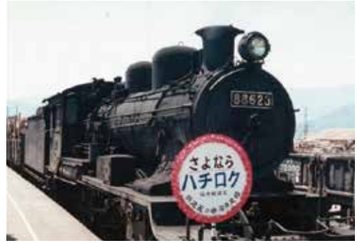
さよならハチロク(昭和48年5月撮影)

中竜鉱山で掘り出された亜鉛鉱の輸送のため、昭和35年頃から大野～福井を走り続けた蒸気機関車(通称ハチロク)。最後は、国鉄路線の無煙化の推進により昭和48年5月27日に引退しました。