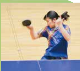
▲気迫あふれる力強いプレーで全国の頂点に

「市民のページ」に参加しませんか？ 大野市で頑張っている人、グループを募集します。詳しくは秘書広報室まで ☎64・4825