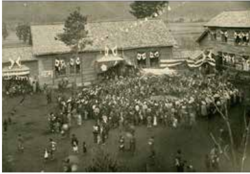
小山小学校落成(大正13年5月撮影)

小山地区の学校は、明治初期より改称や移転を繰り返し、大正13年に現在の場所に校舎を移転、増改築しました。昭和22年に小山小学校と改称し、中学校を併設しました。写真は校舎の落成を祝い、校庭で相撲が行われている様子です。