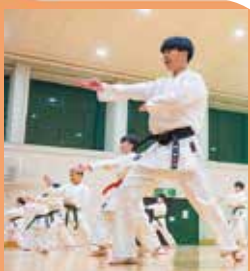
▲指先まで整った素早い動きが空を切ります