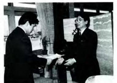
策定案の市長への答申

②児童館や保育所を、子育てに関する地域活動の場として提供・支援します ③幼児教育・家庭教育など教育環境の一層の充実を図ります ④各種文化活動やスポーツ活動の活性化に努めます ⑤児童センターの放課後児童クラブの活動内容の充実を図ります