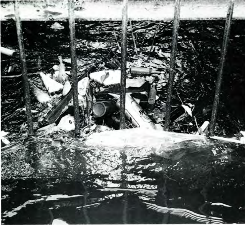
水路のスクリーン下のよどみに漂うごみ

あなたは、何気なく川や水路にごみを捨てた経験はありませんか。水路などに捨てれば自分自身の周りからは、ごみは消えます。しかし捨てられたごみは、無くなりません。下流で大きな問題を引き起こしています。六月の環境月間を機会に、この問題について考えてみましょう。