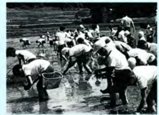
藤生っ子田、田植え