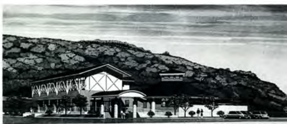
休養施設の完成予想図

応募・問い合わせ先 市役所総合政策課開発推進係 〒912-8666 福井県大野市天神町1-1 ☎0779-66-1111 内線434