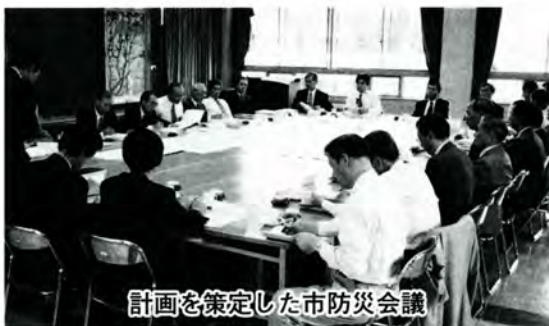
市防災計画を策定した市防災会議

今後市では、防災マップを制作し、市民の皆さんにも災害に備えての心構えや避難所などをお知らせする予定です。職員に対しては、応急対策の徹底を図ります。