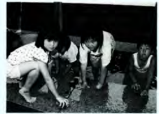
きれいになったでしょ（御清水で清掃奉仕）

社費の募集活動は、日本赤十字社が災害救助活動などの事業を行うための資金を募集するもので、最も大切な活動となつていきます。また、皇居・京都御所などでの清掃奉仕活動もあり、多くの団員が参加しています。