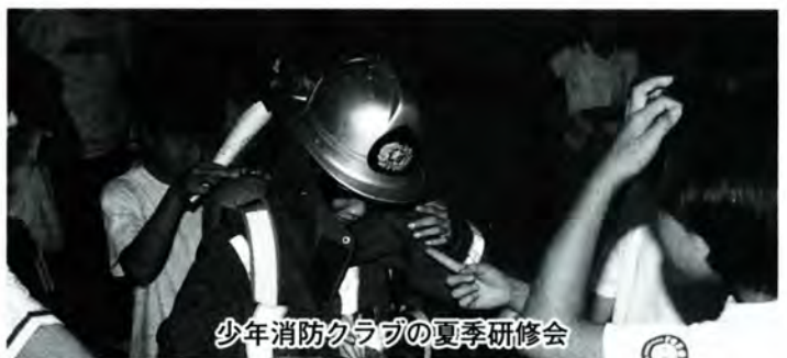
少年消防クラブの夏季研修会