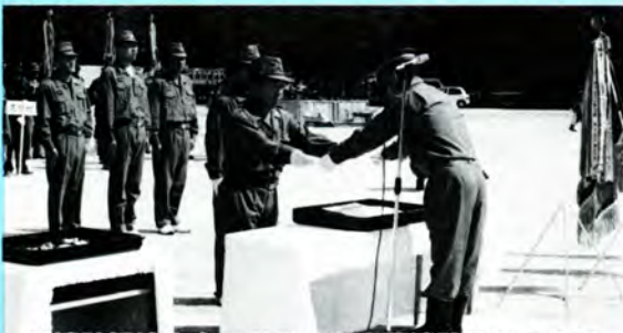
県消防操法大会で優勝した大野消防団第5分団