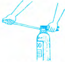
②ホースを火元に向ける。