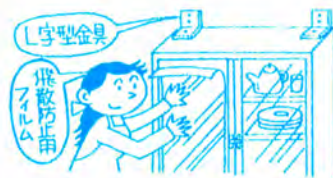
倒れやすいものは固定