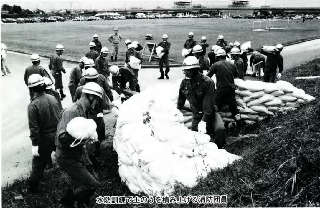
水防訓練で土のうを積み上げる消防団員

今年、福井震災五十周年に当たります。この震災では、当市に関係するたくさんの方々が負傷したり亡くなったりにしています。近年では、平成七年一月の阪神淡路大震災のときにも、市内で大きな揺れを経験していますが、今日では、その記憶も薄れがちになっています。