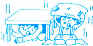
机の下などで体の安全確保

また、普段から非常持ち出し品を準備し、目立ちやすく持ち出しやすいところに置いておくようにしましょう。