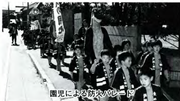
園児による防火パレード

この消防団の上庄地区を管轄する大野消防団第5分団が、7月25日に福井県消防学校で行われた県消防操法大会へ大野消防団の代表として出場し、優勝しました。同時に、10月8日に横浜市で開催される全国大会に県代表として出場することになりました。皆さんの声援をお願いいたします。