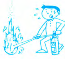
③レバーを強く握る。