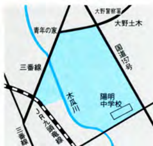
区画整理が計画されている中野周辺