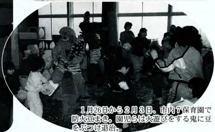
1月26日から2月3日、市内7保育園で防火豆まき。園児らは火遊びをする鬼に豆をぶつけ退治。