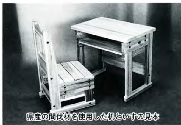
県産の間伐材を使用した机とイスの見本

市が本年度から新しく始めた「大野市産業おこし推進事業」に、三件がこのほど認定されました。この事業は、新規産業を掘り起こし、市の産業界を活性化させることを目的として、研究などに要した費用の一部を市が補助するものです。対象となるのは、新分野の開拓に関する調査や異業種間の融合化による新事業の開拓研究、また、これらの研究成果を具体化させる取り組みなどです。