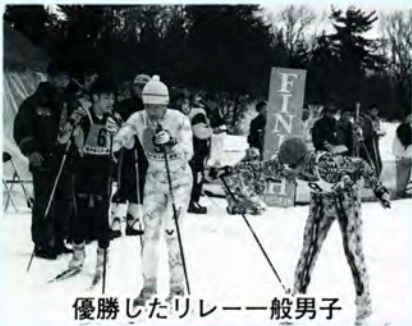
優勝したリレー一般男子

第五十一回県民体育大会冬季大会のスキー競技が、一月二十四日・二十五日に勝山市のスキージャム勝山で開催されました。当市の選手団は、六種目で優勝するなどの活躍をみせ、男女ともに郡市対抗を制しました。スキー競技では、男子が三年連続、女子が二年連続の快挙となります。