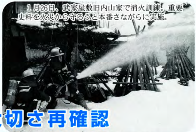
1月26日、武家屋敷旧内山家で消火訓練。重要史料を火災から守ろうと本番さながらに実施。

1月26日の文化財防火デーにちなみ、貴重な文化財や史料などの郷土の宝を火災から守ろうと、防火査察や消火訓練が行われました。また、子供たちに火遊びをしないよう呼び掛ける防火豆まきも、行われました。