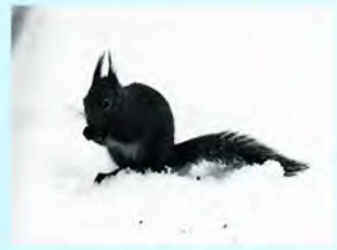
朝9時ごろ出動 (県自然保護センター)