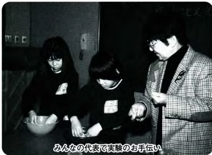
みんなの代表で実験のお手伝い