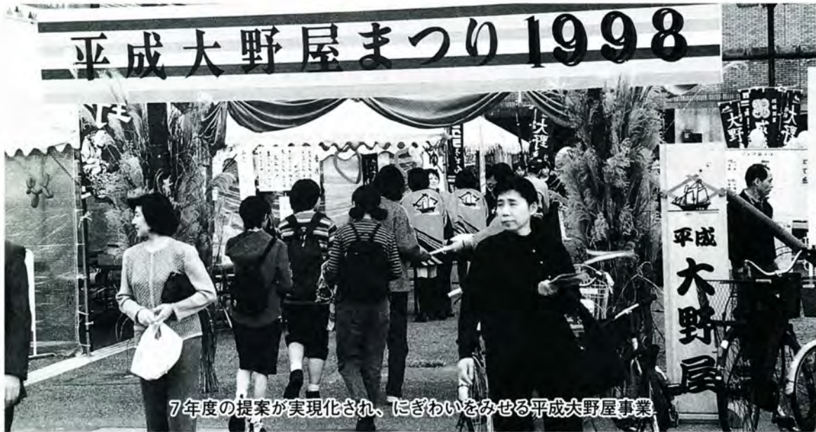
7年度の提案が実現化され、にぎわいをみせる平成大野屋事業