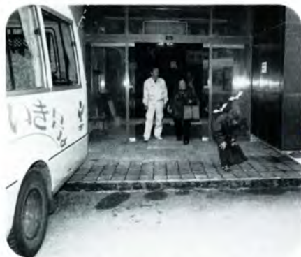
PM 4:00 送迎バスが到着。職員に見送られながら、おばあちゃんたちがセンターを後にします。