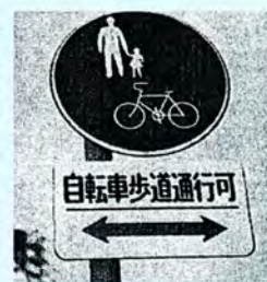
自転車及び歩行者専用

子どもから高齢者まで、多くの人に利用されている自転車。より安全に利用するため、自転車の交通ルールやマナーについて、もう一度確認してみましょう。 自転車は左側通行です。歩道と車道の区別のある道では車道の左端を、区別のない道では左端を通るようにしましょう。 歩道では自転車を降り、押して通行しなければなりません。ただし、次の標識のある歩道では、自転車に乗って通行できます。その場合は、歩道の車道側を通