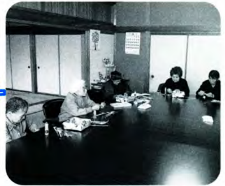
AM 11:30 おふろからあがってきた人たちも加わってみんなで手作業。おしゃべりにも一段と花が咲きます。