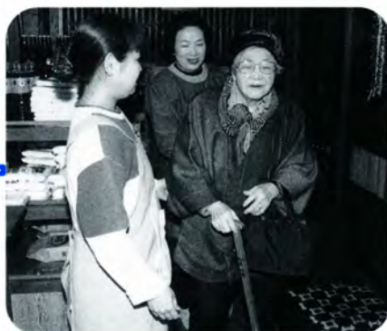
AM 9:50 ヘルパーさんが玄関先まで迎えに来ました。家族に見送られながらセンターへ出発です。

野球観戦が趣味で、以前は東京ドームまで試合を見に行っていたというジャイアンツファンの元気なおばあちゃん。