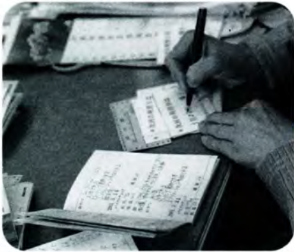
PM 1:30 昼休みの間もヘルパーさんがその日の食事のメニューなどを家庭との連絡帳に書き入れます。