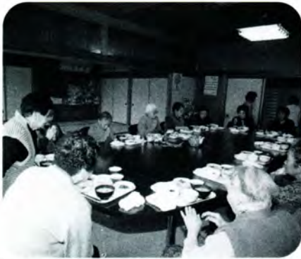
PM 0:00 みんなで一緒に「いただきます」今日のメニューはエビチリソースや煮物、マカロニサラダなど。