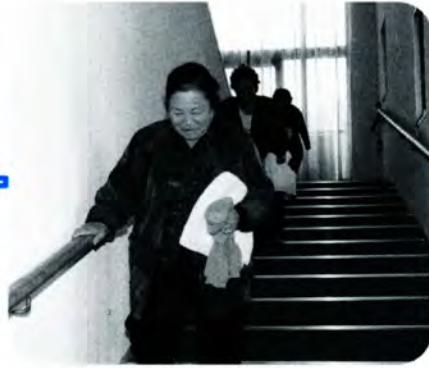
AM 10:40 血圧・体温を測り終えおふろへ。おふろ場に続く段差のゆるい階段をゆっくりと降りて行きます。