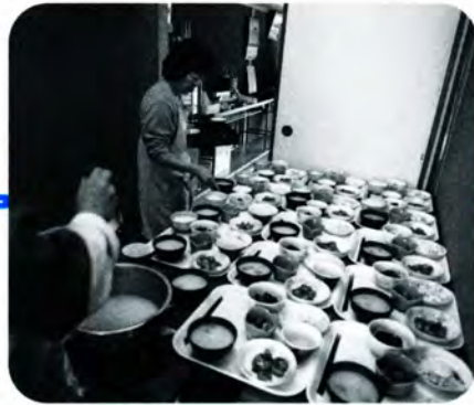
AM 11:45 昼食の用意に大忙し。ヘルパーさんが一人ひとりの量などに気を付けながら盛りつけます。