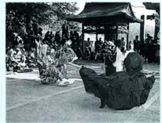
はにやすひめ 壇安姫神社の里神楽