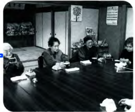
PM 3:00 ゲームが終わっておやつの時間。おしゃべりしながら和やかなひとときを過ごします。

送迎のあるデイサービスは、一人での外出に不安のある人に良いサービスだと思います。「最近表情が明るくなったな」と思ったらデイサービスに通っているということも多いですよ。 福祉サービスなどを上手に利用して、元気なお年寄りがたくさん増えて欲しいですね。