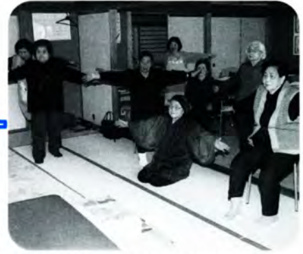
PM 2:00 のんびりと昼休みを過ごした後は体操の時間。体操のビデオを見ながら体を動かします。