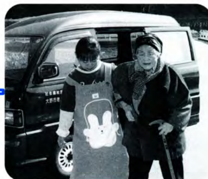
AM 10:00 センターに到着。ヘルパーさんがおばあちゃんを気遣って、そっと手を添えます。