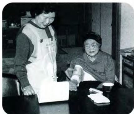
AM 10:15 続いて血圧と体温を測ります。いつもどおりの値におばあちゃんもヘルパーさんにもっこり。