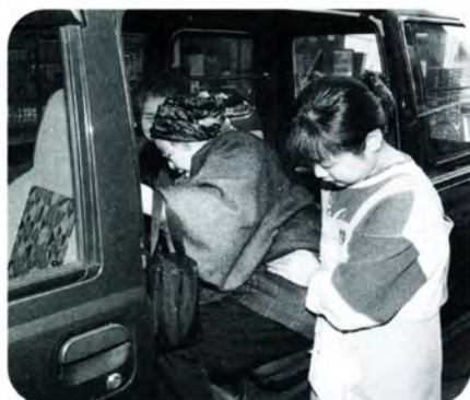
AM 9:51 「よっこいしょ」と車に乗り込みます。ヘルパーさんもお手伝い。