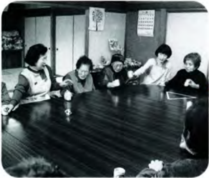
PM 3:25 さて今度は空き缶を使ったゲーム。「よいやさのさ」のかけ声に合わせて隣の人に缶を回します。