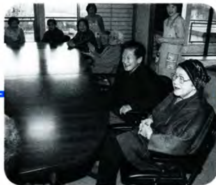
PM 3:50 楽しかったゲームも終わり、もうすぐ送迎の時間。おしゃべりしながらバスを待ちます。