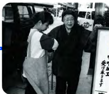
PM 4:10 自宅の玄関前に到着しました。ここでもヘルパーさんがそっと手を添えてくれます。