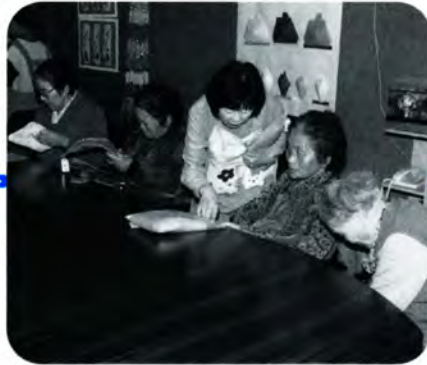
PM 3:10 ヘルパーさんが次回の予定を確認しながら、連絡帳などを入れた袋を配ります。