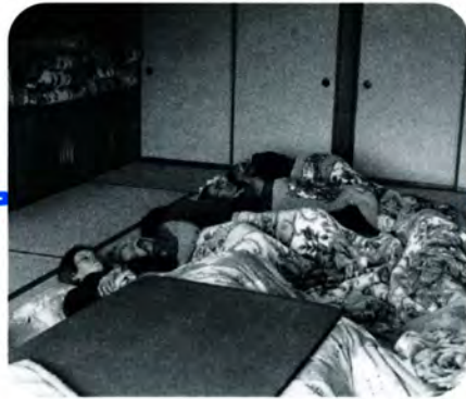
PM 1:00 昼食を終え横になる人も。ポカポカ陽気にウトウトしながら、のんびり食後を過ごします。