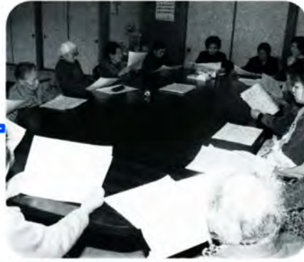
PM 2:15 体を動かした後、今度は歌の時間です。童謡などの歌詞を楽しみ替え歌にして歌います。