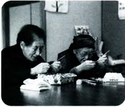
AM 11:00 おふろへ入らないおばあちゃんたちは指先を動かす手作業を、会話しながらのんびり進めます。