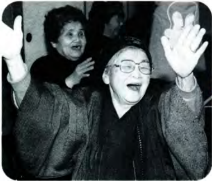
PM 2:41 手を上にあげてバンザイポーズのときおばあちゃん。歌の終わりにばっちり決まっとうれしそう。