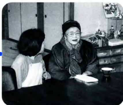
AM 10:05 「一週間お元気でしたか」まずはおしゃべりしながら健康チェック。その日の体調を確認します。