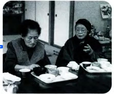
PM 0:15 みんなでいただく昼食に、おばあちゃんたちのはしも進みます。今日のメニューもとても満足。