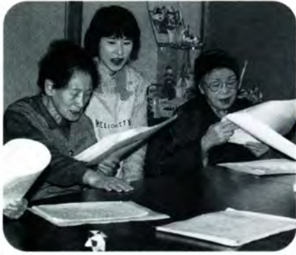
PM 2:20 曲数が進むにつれ、のってきたおばあちゃんたち。声もだんだん大きくなります。