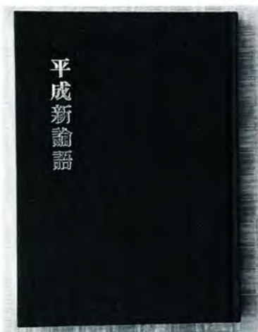
平成新論語 西川冷華 (自費出版)

れました。会に興味のある人は、事務局の大町朝子さん(☎65・7347)まで連絡してください。