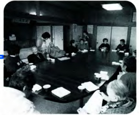
AM 10:20 バスで迎えに行った皆さんもセンターに到着。部屋の中が一気ににぎやかになります。