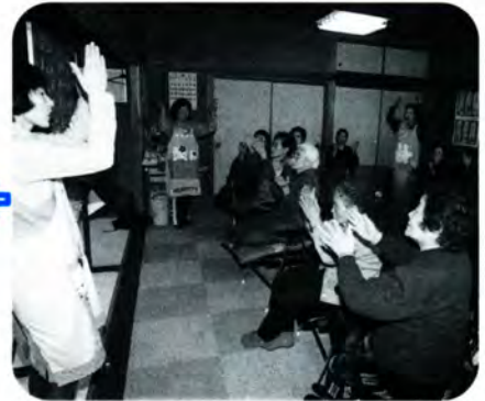
PM 2:35 次は手を動かすゲーム。「ももたろう」の歌に合わせ手拍子しながら上下に手を動かします。