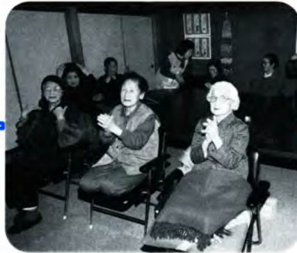
PM 2:40 頭二回に肩二回、ひざに続いて下と上、ヘルパーさんの動きにつられないよう手を動かします。