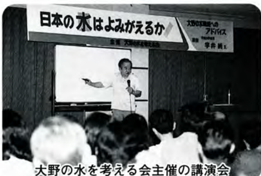
大野の水を考える会主催の講演会