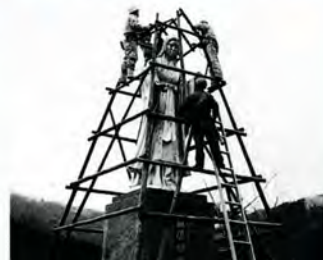
麻那姫像も冬支度