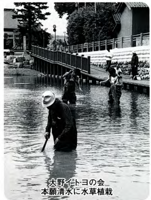
大野イトヨの会 本願清水に水草植栽