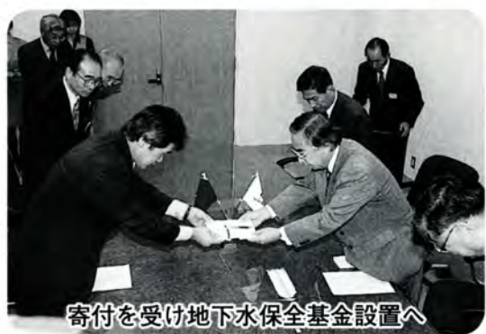
寄付を受け地下水保全基金設置へ