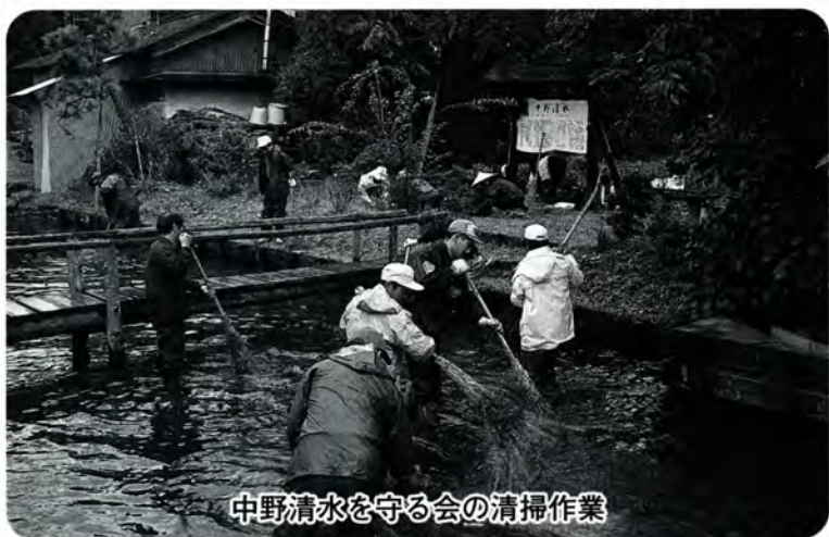
中野清水を守る会の清掃作業

このような活動に対して、市では「テーマコミュニティ支援事業」を行っています。これは、住民参加型の地域づくり活動を実践している団体に対して活動を支援していくことと、平成十一年度から行っているものです。これまでに、休耕田に花菖蒲を植え