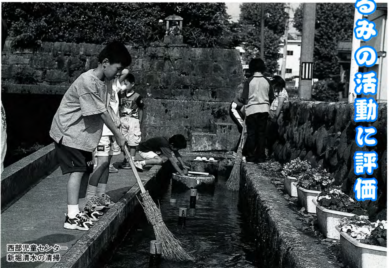
西部児童センター 新堀清水の清掃

県内では平成二年度の上中町に次いで二番目の受賞です。また全国ではこれまでに六十一の自治体が受賞しています。