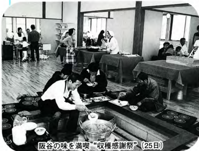
阪谷の味を満喫“収穫感謝祭” (25日)

11月18日と25日に「スターランドさかだに」で今年の収穫を祝う収穫感謝祭が行われ、秋の味覚を楽しむたくさんの人でにぎわいました。