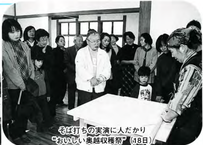
そば打ちの実演に人だかり “おいしい奥越収穫祭” (18日)