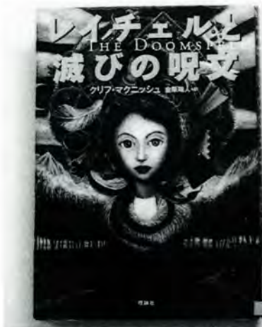
『レイチェルと滅びの呪文』 クリフ・マクニッシュ 作 金原瑞人 訳・理論社

二〇〇一年は「ハリー・ポッター」シリーズの本が、群を抜いてベストセラーとなりました。映画も公開され、関連商品やゲームソフトなど、人気は当分続きそうです。