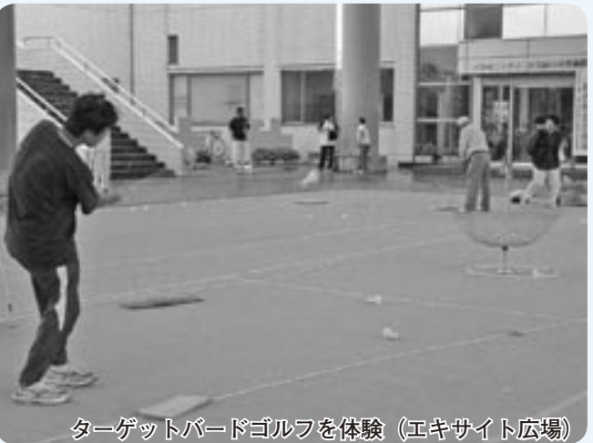
ターゲットパードゴルフを体験（エキサイト広場）

10月2日から5日にかけて「第17回全国スポーツ・レクリエーション祭」（スポレク福井2004）が県内各地を会場に開催されました。本市では、羽根のついたボールを素手で打ち合うインディアカ大会に、全国から44チーム405人が参加。熱戦を繰り広げました。