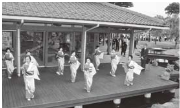
イトヨ音頭をご観覧（本願清水イトヨの里）