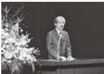
トゲウオサミットでお言葉