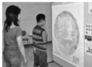
アートマンダラ作品展 (ショッピングモールVIO)

■「広報おおの」では、皆さんの活動や意見など、さまざまな内容を募集しています。あなたも紙面に参加しませんか。