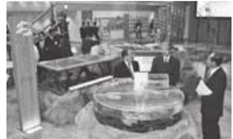
九頭竜川資料館をご視察（永平寺町）