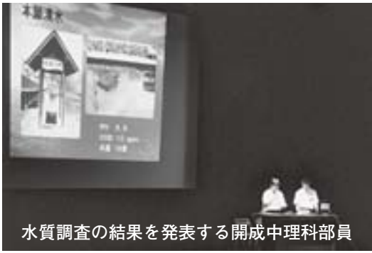
水質調査の結果を発表する開成中理科部員

たちへの環境教育の取り組みなどを報告しました。 第二部のパネルディスカッションでは、本願清水イトヨ