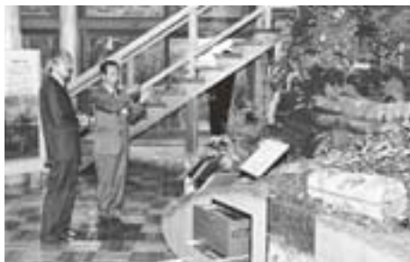
県自然保護センターをご視察（南六呂師）