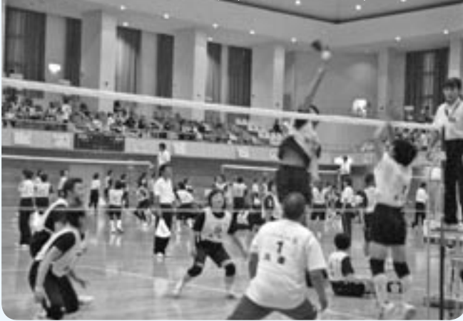
自熱するインディアカ大会（エキサイト広場）

10月2日から5日にかけて「第17回全国スポーツ・レクリエーション祭」（スポレク福井2004）が県内各地を会場に開催されました。本市では、羽根のついたボールを素手で打ち合うインディアカ大会に、全国から44チーム405人が参加。熱戦を繰り広げました。