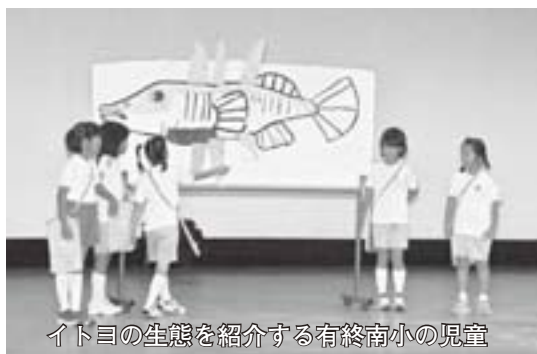
イトヨの生態を紹介する有終南小の児童

カ所で行った調査から「下流に行くほど汚れている。生活排水などが流れ込んでいるのでは」と分析しました。