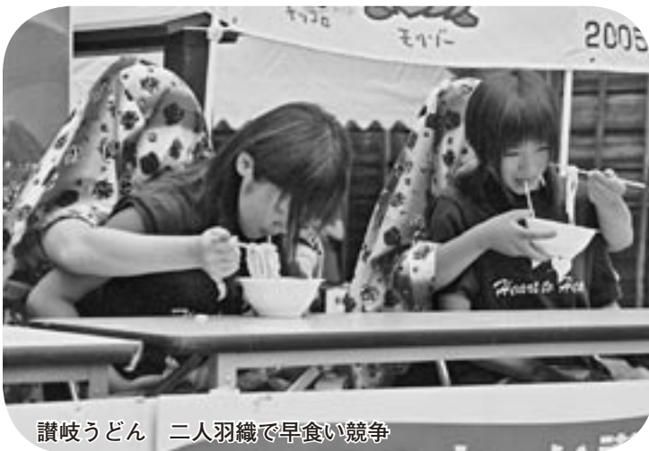
讃岐うどん 二人羽織で早食い競争