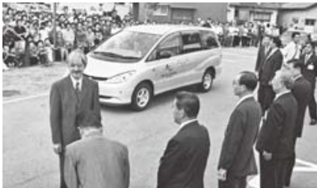
本願清水イトヨの里にご到着