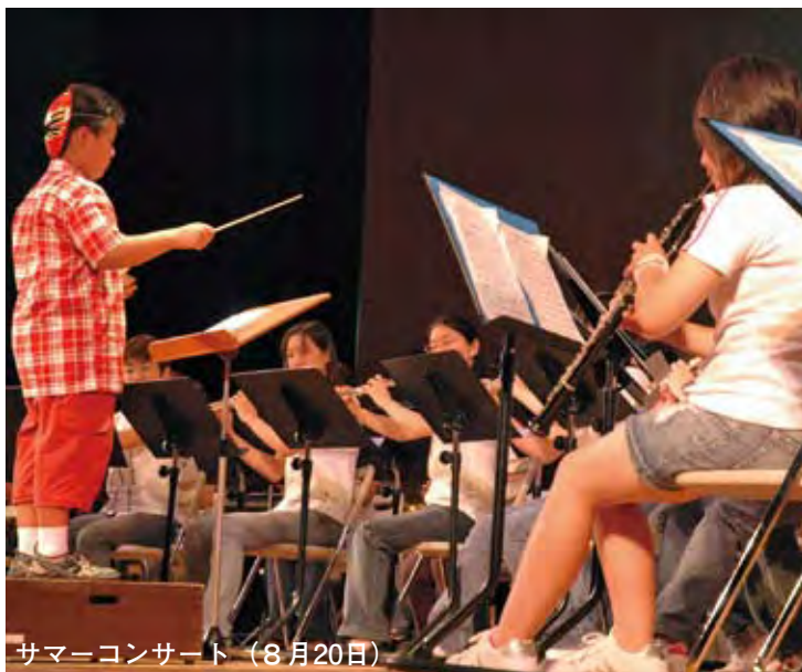
サマーコンサート（8月20日）