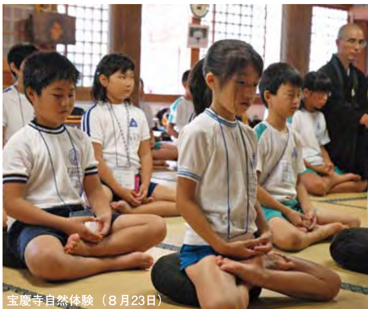
宝慶寺自然体験（8月23日）