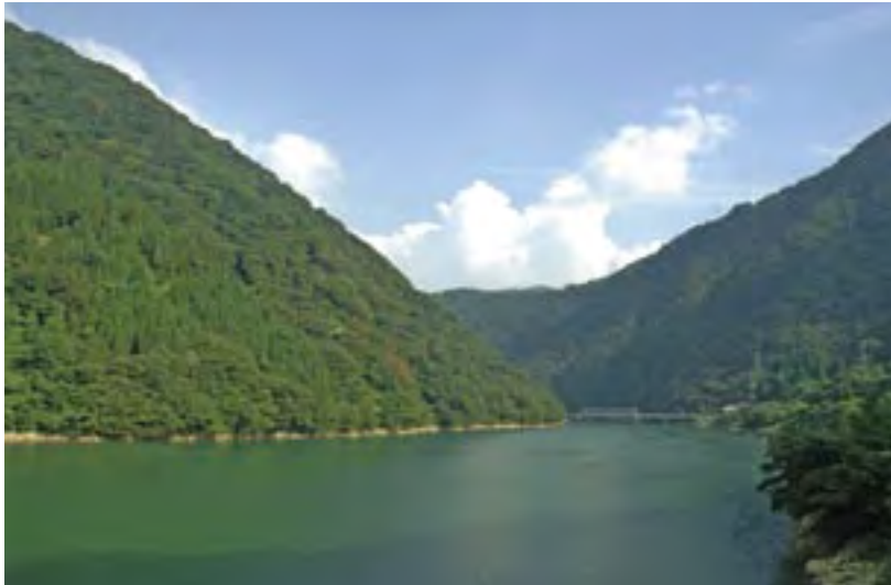
大野市と和泉村を結ぶ国道158号からの美しい眺め

に来てくれて、私も妻もとても楽しみにしています。親御さんたちにも親戚のようなお付き合いをしてもらっています。そういったことを期待して和泉村に来たのではないのですが、今考えてみるとそれが一番の魅力なのかなと思います。