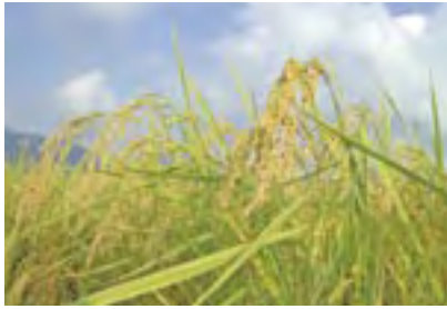
豊かに実った黄金色の稲穂