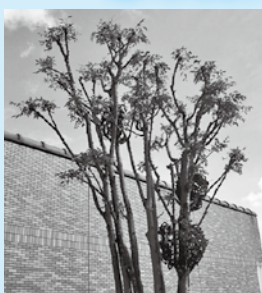
「樹ノ地球」 坂井ヒロミ作 歴史民俗資料館前