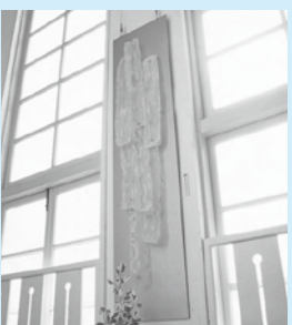
「トドマルコトナクヨドミナク」 金井さつき作 平成大野屋