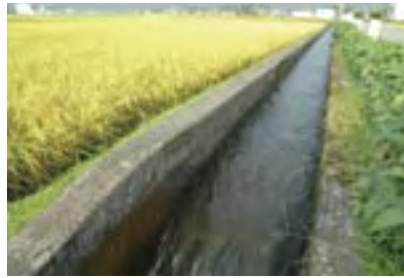
絶え間なく聞こえる水の音