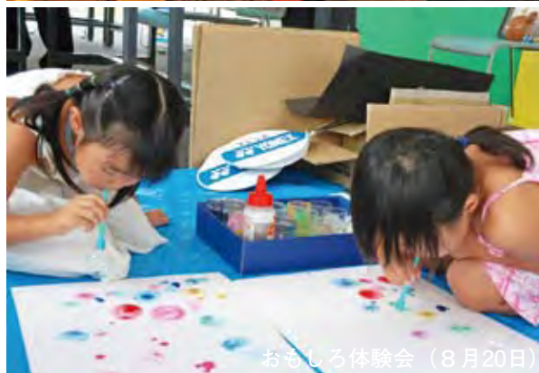
おもしろ体験会（8月20日）