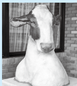
「風 湿るの」 栗山絵美子作 図書館前