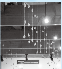
「ヒカリノアメ」 池亀はるみ作 本願清水イトヨの里