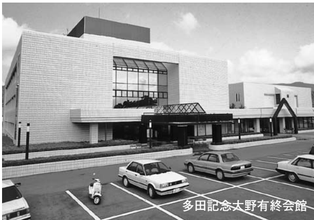
多田記念大野有終会館

指定管理者の選定方法は、利用者代表、学識経験者、市の担当部課長で構成する選定委員会で意見を集約します。その後、市長または教育委員会が候補者を選定し、議会の議決を経て決定します。なお選定委員会は公開で行います。