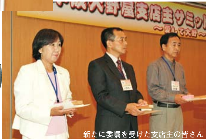
新たに委嘱を受けた支店主の皆さん