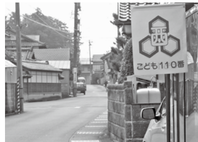
緊急時の駆け込み場所として重要な「110番の家」。地域住民の協力が子供たちの安全を守っています