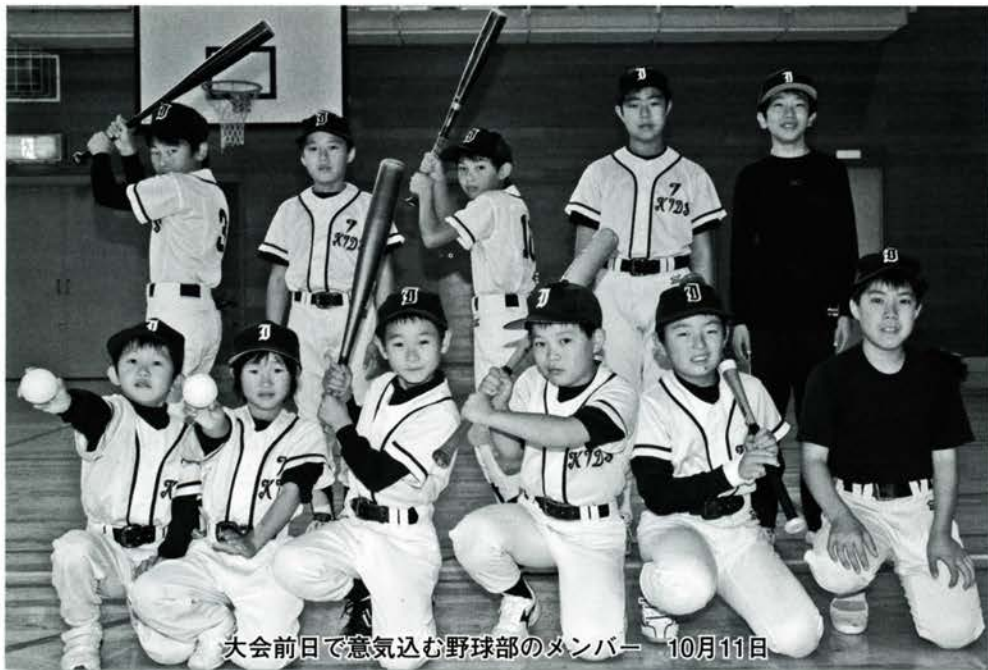
大会前日で意気込む野球部のメンバー 10月11日

あなたも紙面に参加しませんか。希望する方は 情報広報課まで ☎0779・66・1111