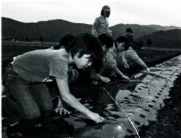
ドングリを植える様子 (10月12日・エコフィールド)