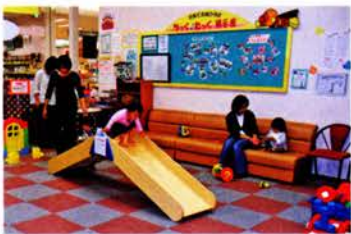
子育て交流ひろば「ちくたつく」 ※今月の行事は別冊みつけを参照