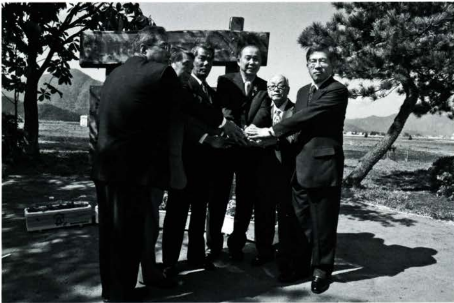
※「共働」一緒に汗を流そうという意味を表す造語

市は、緑化活動や環境保全の拠点として、平成十五年五月に取得した旧上庄種苗事業所跡地（稲郷、約三万二千平方メートル）を「越前おおのエコフィールド」として整備。十月八日、エコフィールドに市長や一緒に事業を展開する団体・企業の代表六人が集い、「越前おおのエコフィールド共働宣言」を発表し、記念植樹を行いました。 今後、このフィールドをより有効に活用し、環境保全活動を楽しみながら末永く広げていくこととしています。