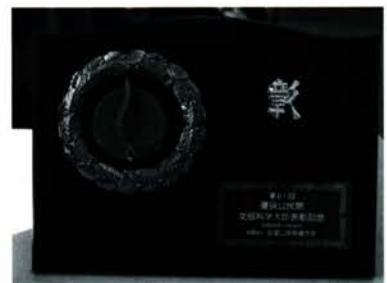
文部科学大臣表彰受賞記念の盾

大野公民館六十周年記念式典が十月十九日、学びの里めぐり「いりん」で開かれました。同館は旧大野町だった昭和二十三年に開設。式典では六十年