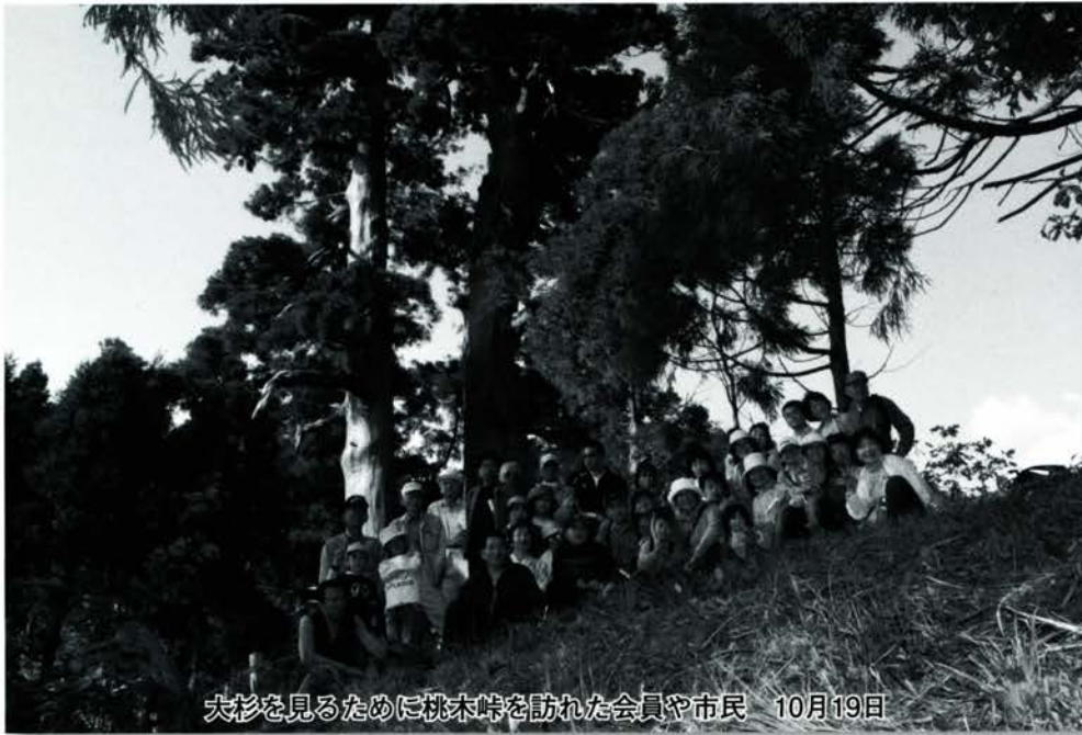
大杉を見るために桃木峠を訪れた会員や市民 10月19日

あなたも紙面に参加しませんか。希望する方は 情報広報課まで ☎0779・66・1111