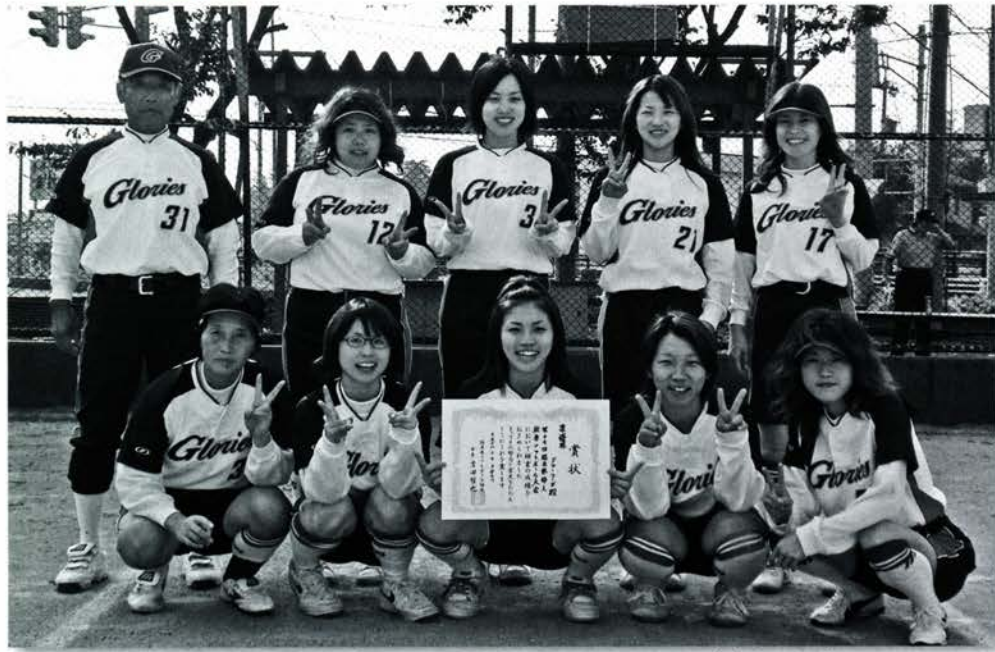
準優勝した県婦人ソフトボール大会秋季大会（昨年10月）

「ソフトボールをみんなで楽しく」をモットーに活動しているのが「グローリース」です。大野高校ソフトボール部の出身者を中心としたメンバーが「栄光をつかもう」という意味を込めてクラブの名称を決め、十六年前に創設したそうです。現在は、二十歳代から五十歳代までの女性十二人が子育てや家事、仕事との両立をさせて活動しています。