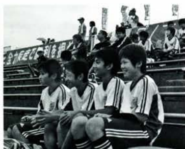
試合を観戦し末永選手を応援する会員（6月22日、テクノポートスタジアム）

あなたも紙面に参加しませんか。希望する方は 情報広報課まで ☎0779・66・1111