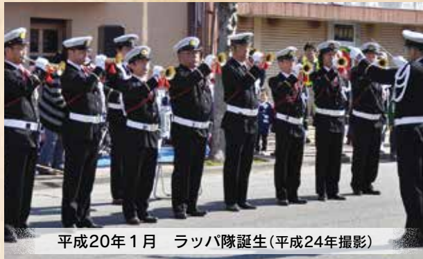
平成20年1月 ラッパ隊誕生(平成24年撮影)