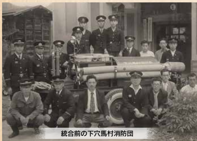
統合前の下穴馬村消防団