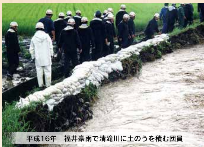
平成16年 福井豪雨で清滝川に土のうを積む団員