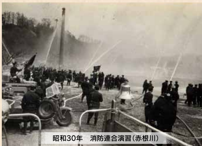
昭和30年 消防連合演習(赤根川)