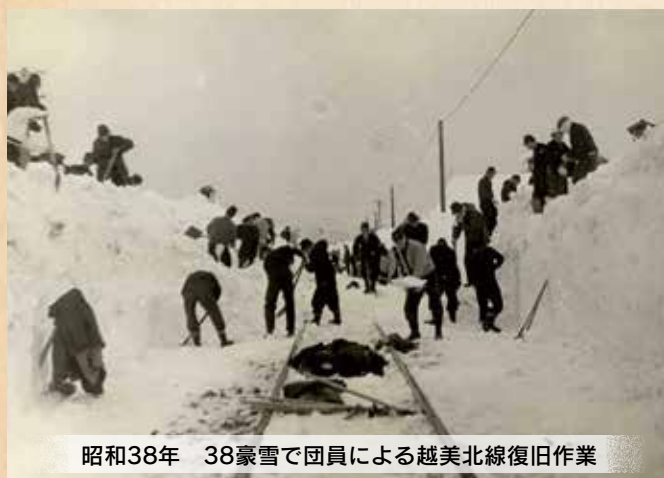
昭和38年 38豪雪で団員による越美北線復旧作業