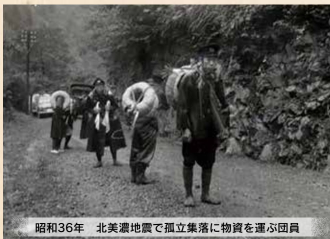
昭和36年 北美濃地震で孤立集落に物資を運ぶ団員