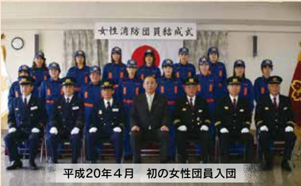
平成20年4月 初の女性団員入団