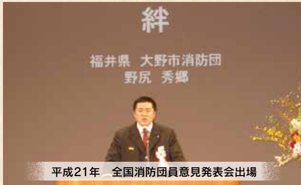
平成21年 全国消防団員意見発表会出場