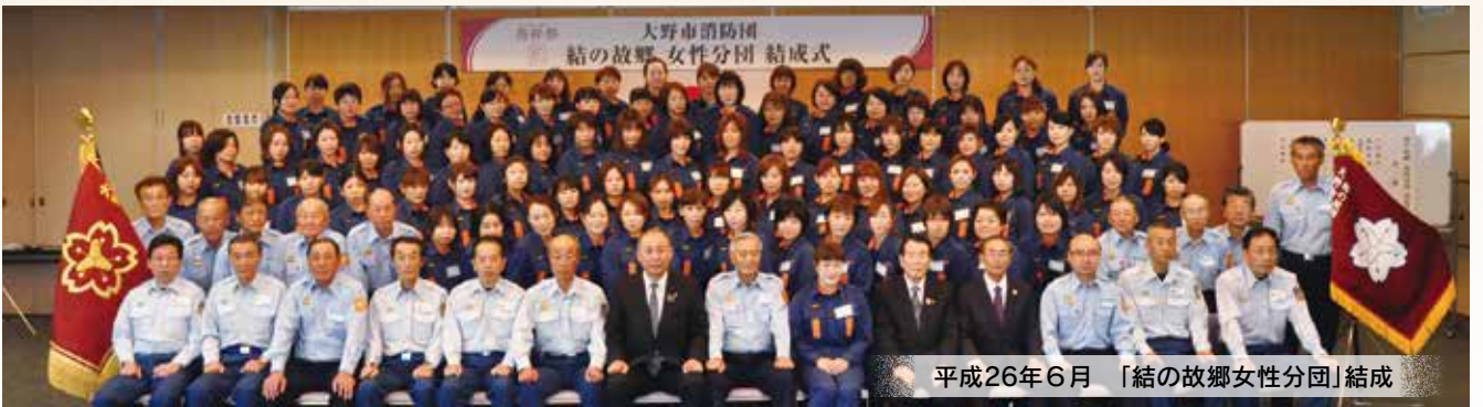
平成26年6月 「結の故郷女性分団」結成