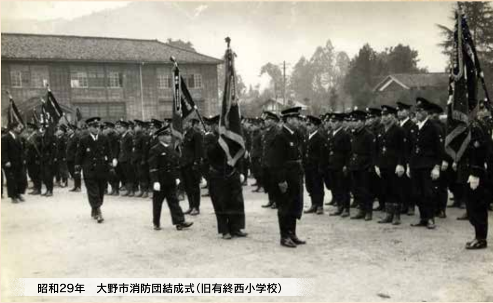
昭和29年 大野市消防団結成式(旧有終西小学校)