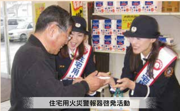
住宅用火災警報器啓発活動