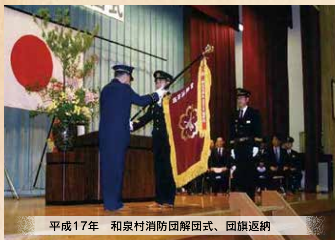
平成17年 和泉村消防団解団式、団旗返納