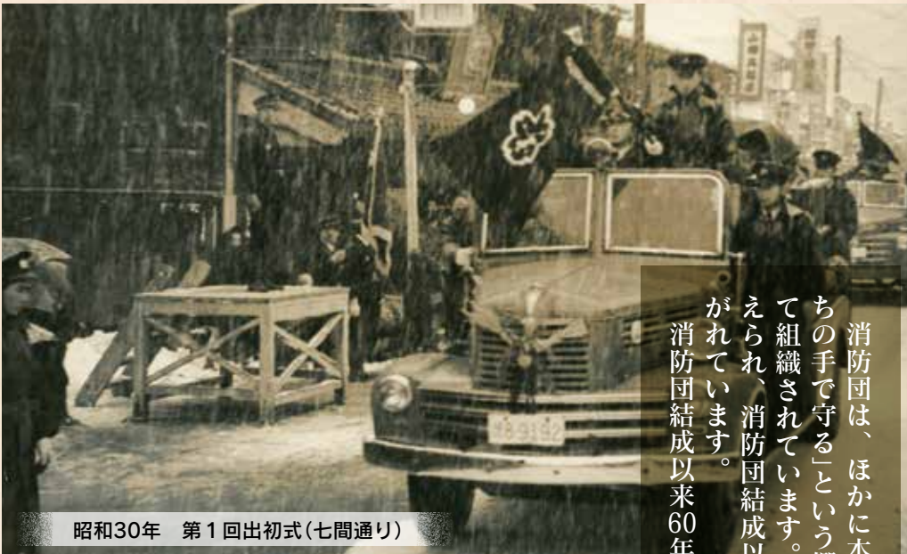
昭和30年 第1回出初式(七間通り)

消防団は、ほかに本業を持ちながら、「自分たちのまちは自分たちの手で守る」という郷土愛護の精神に基づき、地域の有志によって組織されています。この消防精神は、結の心と強い使命感に支えられ、消防団結成以来、今日に至るまで広く消防団員に受け継がれています。 消防団結成以来60年間の歩みを紹介します。