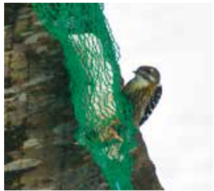
野鳥のレストランでお食事