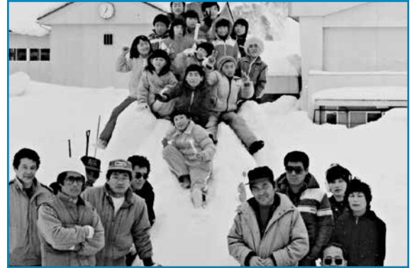
雪像コンテスト：昭和59年3月撮影

乾側小学校が開いた雪像コンテストで、尾永見チームの親子が力を合わせて、滑り台を完成させました。この後、子どもたちは何度も滑り台を楽しんだことでしょう。