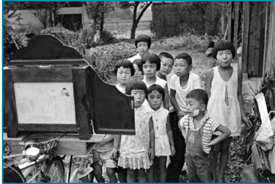
紙芝居：昭和35年9月撮影

犬山区で行われた巡回子ども会で、紙芝居を上演している様子です。当時、紙芝居は子どもたちの間で人気を博しましたが、昭和30年代にテレビが普及するようになると、次第にその姿を消していきました。