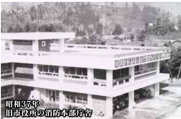
昭和37年 旧市役所の消防本部庁舎