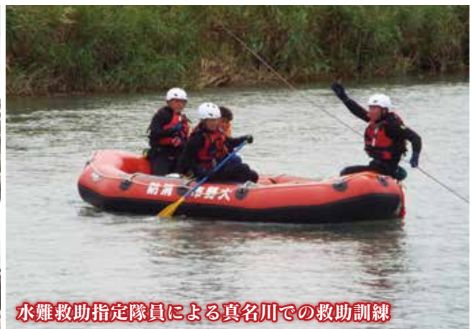
水難救助指定隊員による真名川での救助訓練