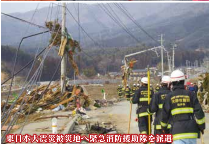
東日本大震災被災地へ緊急消防援助隊を派遣