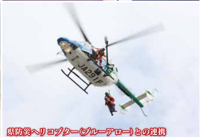
県防災ヘリコプター(ブルーアロー)との連携