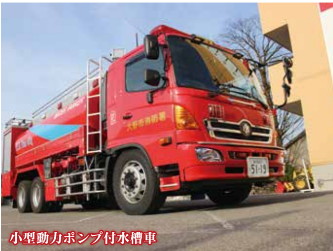
小型動力ポンプ付水槽車