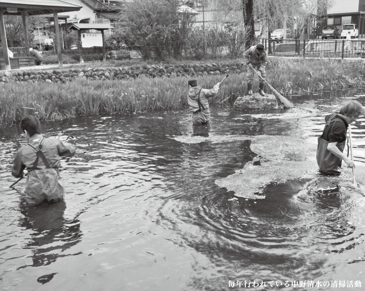
毎年行われている中野清水の清掃活動

地球温暖化防止や環境美化、そして環境保全のために日常生活でできることを考えてみましょう。