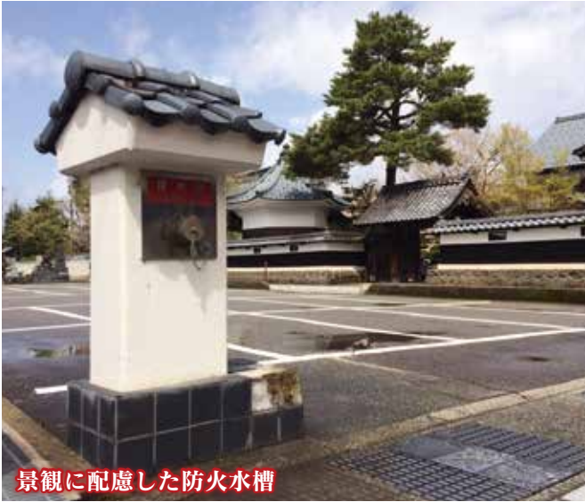
景観に配慮した防火水槽

火災発生時、水利の確保が困難な場所では、10トンの水を積載した小型動力ポンプ付水槽車や、少ない水で消火活動が可能な圧縮泡消火システムなどを装備した車両を活用しているほか、市内各地に防火水槽を整備し、日夜火災などの災害に備えています。