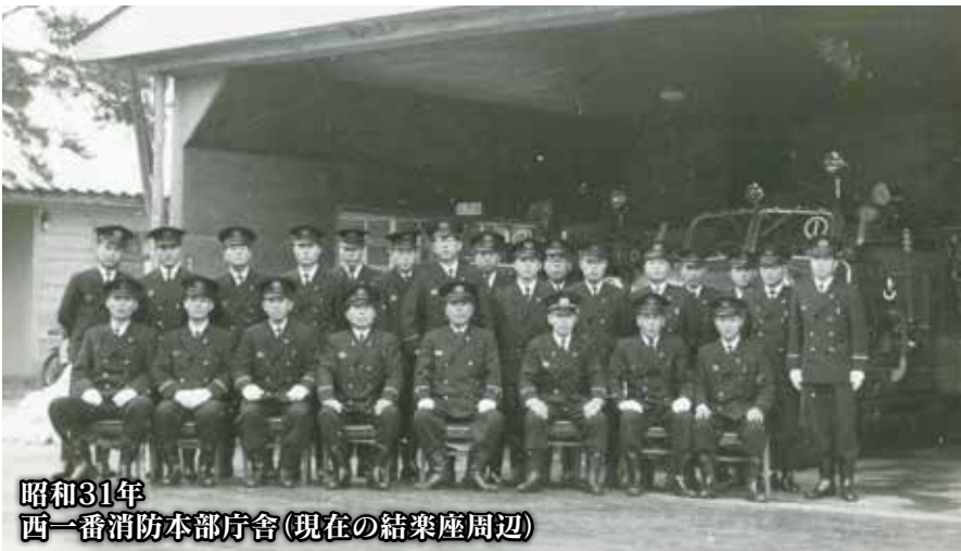
昭和31年 西一番消防本部庁舎(現在の結楽座周辺)

昭和30年9月1日に市消防本部・署が設立されて以来、60年の節目の年を迎えました。この間、あらゆる災害から地域と住民を守るため、身をこめて活動を行ってこられた先人の偉業と消防の伝統を受け継ぎ、さらなる飛躍と「災害に強いまちづくり」の推進に努めてまいります。 今回、60周年を契機として、ここに取り組みの一端を紹介します。 消防署 ☎66・0119