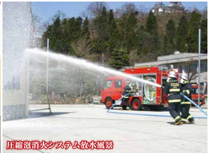
圧縮泡消火システム放水風景