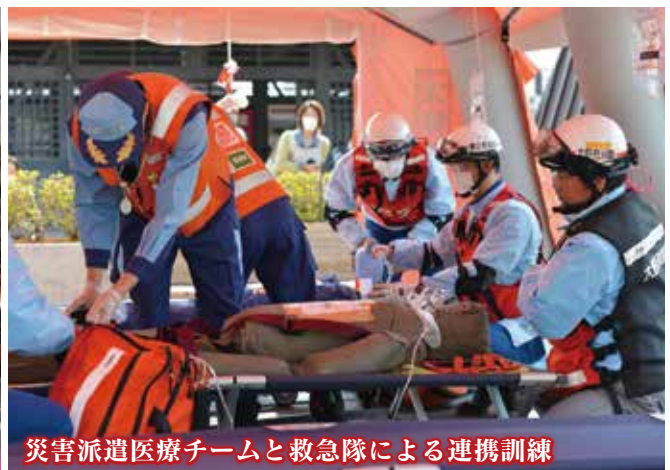
災害派遣医療チームと救急隊による連携訓練