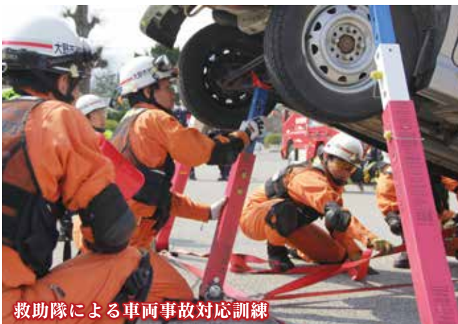
救助隊による車両事故対応訓練