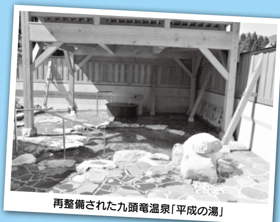
再整備された九頭竜温泉「平成の湯」