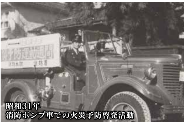
昭和31年 消防ポンプ車での火災予防啓発活動