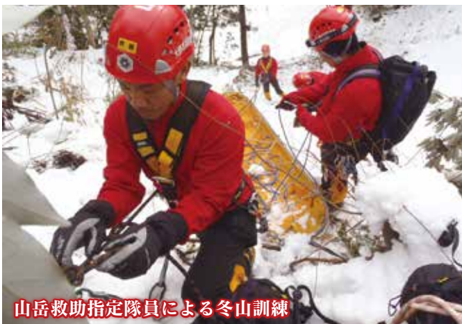
山岳救助指定隊員による冬山訓練

火災、救急、救助などの訓練を積み重ね、多様化する災害に立ち向かいます。また、東日本大震災などの大災害への緊急消防援助隊の派遣、災害派遣医療チームや県防災ヘリコプターとの連携訓練など、広域的な活動を展開しています。