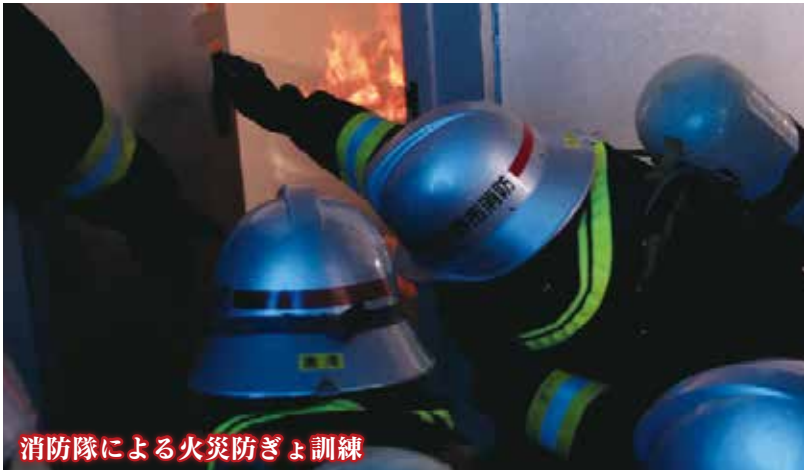
消防隊による火災防ぎょ訓練

火災、救急、救助などの訓練を積み重ね、多様化する災害に立ち向かいます。また、東日本大震災などの大災害への緊急消防援助隊の派遣、災害派遣医療チームや県防災ヘリコプターとの連携訓練など、広域的な活動を展開しています。