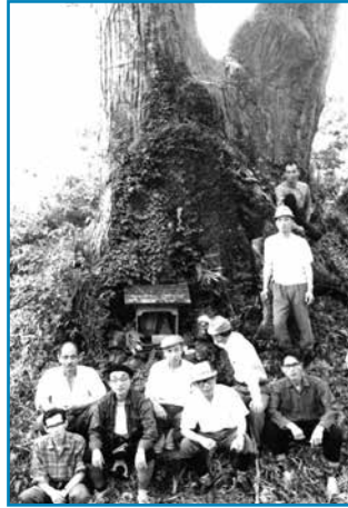
桃木峠の大杉：昭和42年ごろ撮影

打波の嵐と阪谷の金山を結ぶ桃木峠の峠道は、五箇の人たちの大切な生活道路でした。この峠に立つ大杉は泰澄大師が白山登拝のとき、昼食で使った杉箸が成長したという言い伝えがあります。