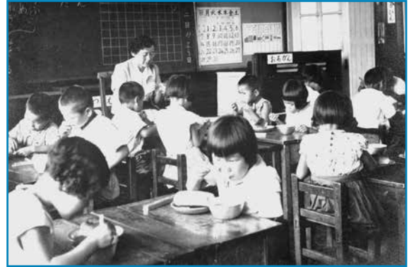
阪谷小学校の給食：昭和30年ごろ撮影

黒板に「ぱん、ばた、とうふ、わかめ、たまねぎ、みそしる」と書いてあるので、この日の献立はコッペパンとバター、それにみそ汁だったようです。男子児童の髪は短く、女子はそろっておかっぱ頭です。