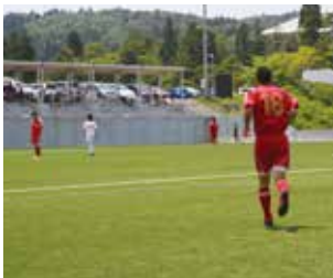
ケガを押して戦いに挑む後輩 年は20歳