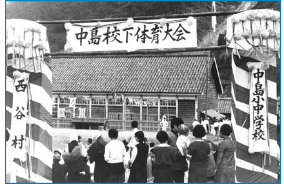
中島校下の体育大会：昭和42年撮影

大きな石が取り除かれて平らになった校庭に人が集まり、これから中島小中学校の体育大会が始まるようです。大水害から1年半たった昭和42年4月、中島小中学校がようやく再開されましたが、真名川ダム建設の本決まりとなって、同44年8月に廃校となりました。