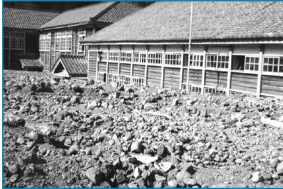
旧西谷村の集中豪雨：昭和40年9月撮影

いまから50年前の昭和40年9月、2日間で1000ミリのを超えるような豪雨が旧西谷村を襲いました。このため雲川、笹生川、鎌谷川が氾濫して真名川に濁流が集中し、中島小中学校の校庭が土砂で埋まりました。