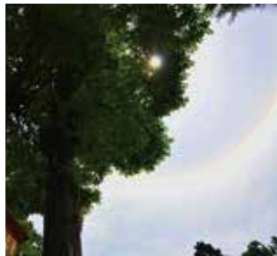
良緑の樹と虹の輪