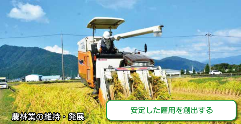
農林業の維持・発展