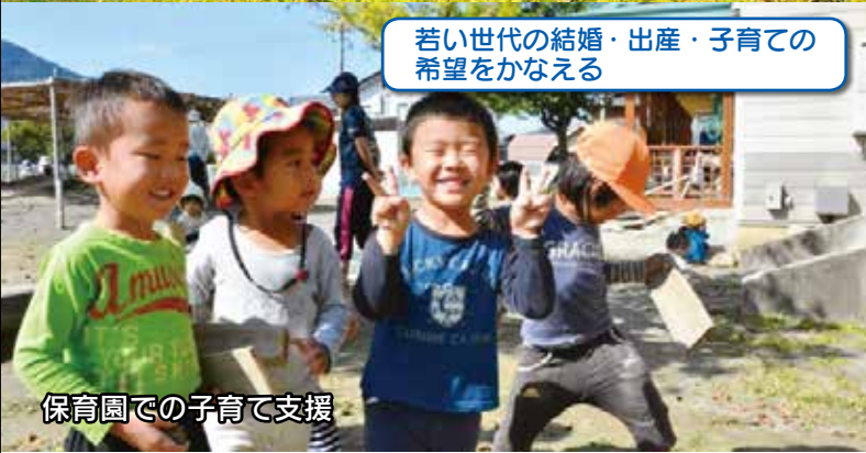
保育園での子育て支援