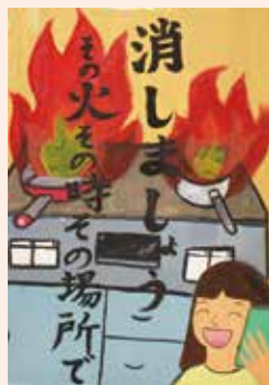
原綾伽さん(6年)の作品