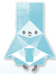
水の精「みずのめぐみん」