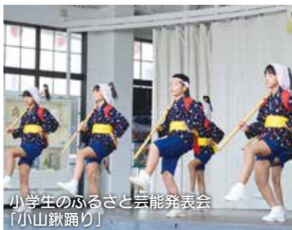
小学生のふるさと芸能発表会 「小山鉾踊り」