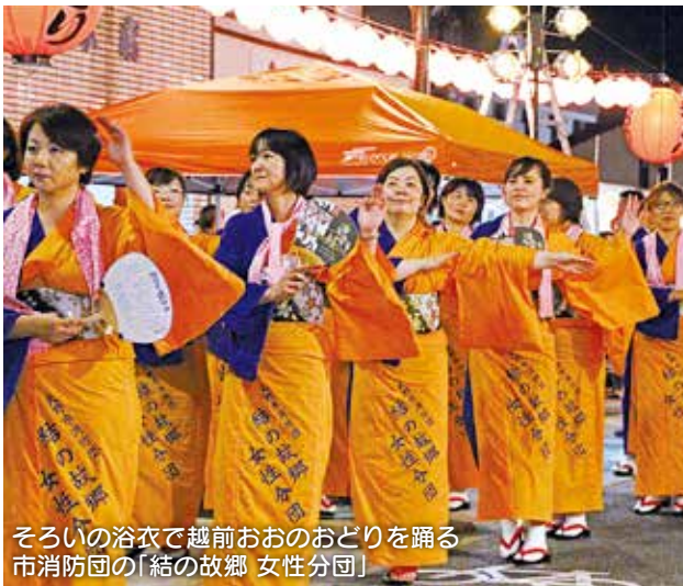
そろいの浴衣で越前おおのおどりを踊る 市消防団の「結の故郷 女性分団」