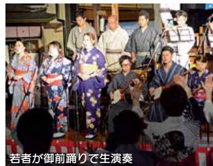
若者が御前踊りで生演奏