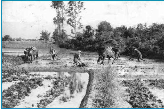
菖蒲池の代かき作業：昭和14年5月撮影

1枚の水田に3頭の農耕馬が入って、共同で代かき作業をしています。男性が馬を巧みに操り、マンガ(馬鍬)を引かせて、土を細かく平らにしています。