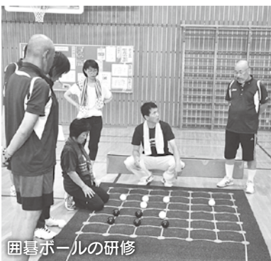
碁碁ボールの研修

平成30年に福井国体が開催されます。毎年、開催の2年前に当地でスポーツ推進委員の全国大会が開催されます。今年も福井の番で、全国の仲間をおもてなす準備を進めています。国体では、大野市にも全国から多くの選手が訪れます。各競技が滞りなく運営され、選手らが力を存分に発揮できる環境を整えるためにも、スポーツ推進委員の活躍が期待されます。