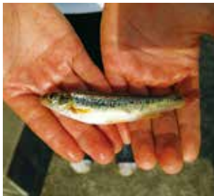
あっぱ + へ = あっぱへ

小学生の頃、開成中学校近くの赤根川で友達とよく釣りをした。「あっぱへ」が釣れると、またかと要らないもの扱いしていた。実は、「あっぱへ」、「しよんべたん」は、イトヨと同じくきれいな水にしか住まない魚だぞうだ。 最近、赤根川で釣りをすると子どもを見かけなくなりましたが、先日、息子が畑にいた虫を餌に「あっぱへ」を釣った。「あっぱへ」が居てうれしかった。