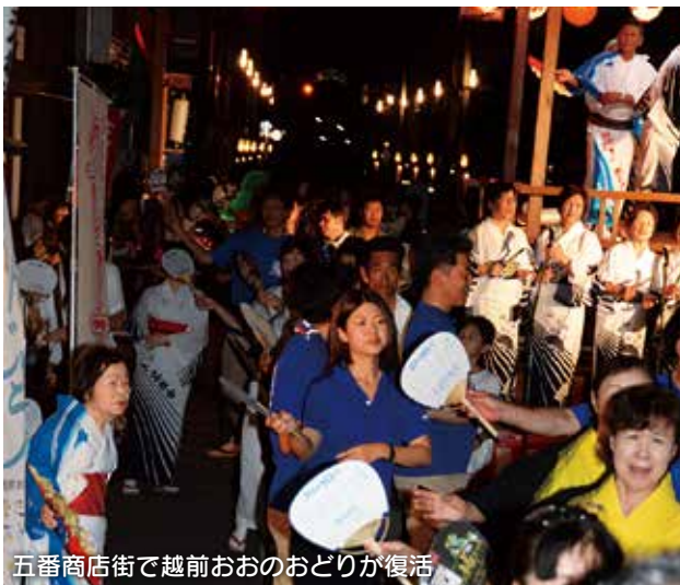
五番商店街で越前おおのおどりが復活