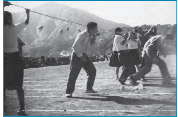
町民体育大会：昭和28年10月撮影

大野町の体育大会の「パン食い競走」の様子です。ロープに吊り下げられた揺れるパンをくわえようとみんな夢中になっています。最近は「パン食い競走」を行う学校や地区も少なくなっています。