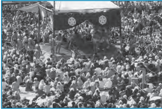
大相撲大野場所：昭和59年10月撮影

昭和59年10月、市制30周年記念大相撲大野場所が市民グラウンド(現在の市役所)で行われたときの様子です。会場は多くの観客でにぎわい、大相撲人気の高さが分かります。