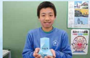
これからも「CWP」を応援してね!

これからも「水への恩返し Carrying Water Project」ではさまざまな活動をしていくから、みんなで一緒に盛り上げていこうね!!