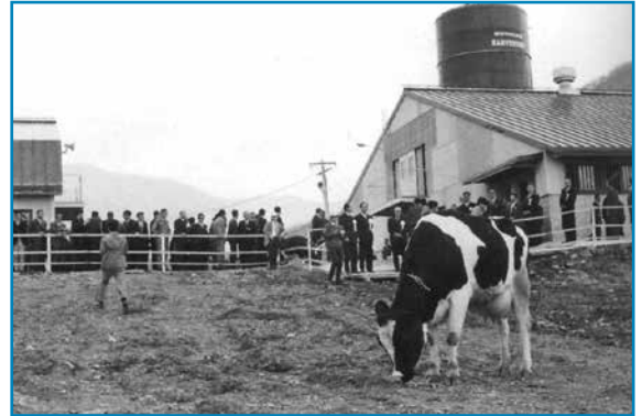
奥越高原牧場：昭和46年撮影

昭和46年、六呂師高原に福井県奥越高原牧場が完成したときの様子です。この牧場では質の良い牧草を生産するとともに、県内の酪農家から子牛を預かり、牧場で育てたあと妊娠牛にして返していました。