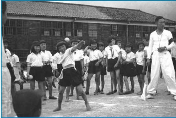
体力テスト：昭和30年ごろ撮影

阪谷小学校の校庭で女子児童が、ソフトボールの球を遠くに投げようとしています。これは全校児童を対象に行われた体力テストで、旗を持った先生が立っています。