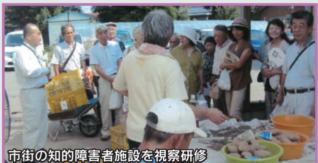
市街の知的障害者施設を視察研修