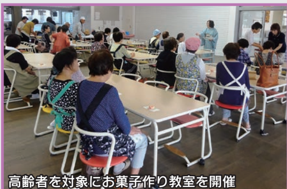
高齢者を対象にお菓子作り教室を開催