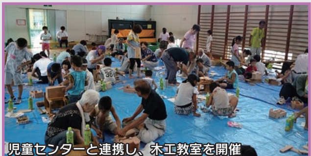
児童センターと連携し、木工教室を開催