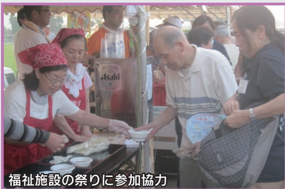
福祉施設の祭りに参加協力