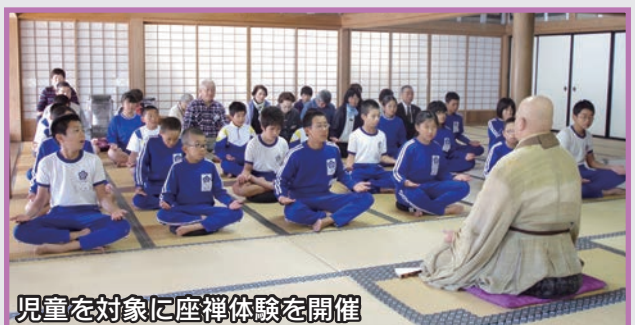
児童を対象に座禅体験を開催