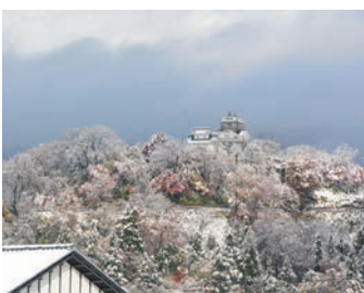
龜山に白い花が咲きました