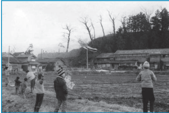
たこ揚げ大会：昭和47年撮影

城町2区子ども会が亀山周辺でたこ揚げ大会を実施している様子です。最近では、たこ揚げをして遊ぶ子どもの姿もあまり見られなくなってきました。