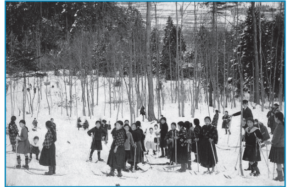
スキー学習：昭和13年頃撮影

有終女子小学校の児童が、飯降スキー場でスキー学習をしている様子です。この時代は、長靴スキーで普段の服装のままスキー学習に取り組んでいたのが分かります。