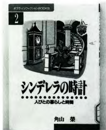
『シンデレラの時計』 角山 榮著 ポプラ社