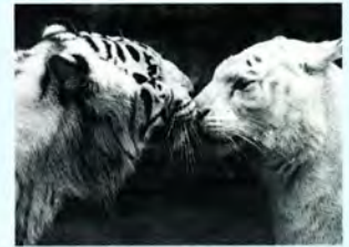
今年もよろしくね (宝塚のホワイトタイガー)