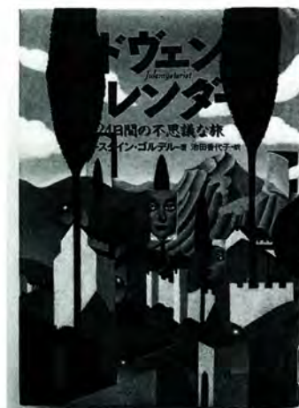
ヨースタイン・ゴルドル著 NHK出版

この物語の主人公ヨアキムのカレンダーには、絵と薄い紙切れに書かれた物語が入っています。