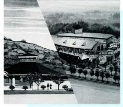
⑩ ファミリーリゾートや健康保養 施設、スターランドなど進展