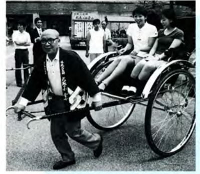
⑨ 越前こぶし組念願の 2台目人力車購入