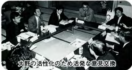
大野の活性化のため活発な意見交換