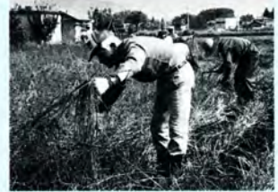
手打ちの味が楽しみです (小山福寿会ソバ刈り)