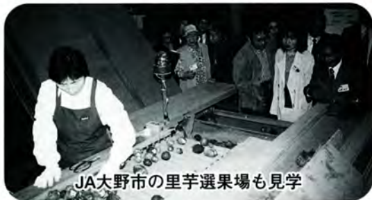
JA大野市の里芋選果場も見学

全国の「大野さん」に呼び掛け、市のPRをお願いする平成大野屋の「寄り合い」が、十月二十五日と二十六日に有終会館などで行われました。今年、まだ支店主がいなかった北海道、佐賀県などから十四人を委嘱したほか、昨年委嘱した支店主八人も参加。本店番頭会による大野屋の説明や市内散策などをしたのち、大野の活性化に向け、活発な意見交換を行いました。