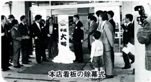
本店看板の除幕式