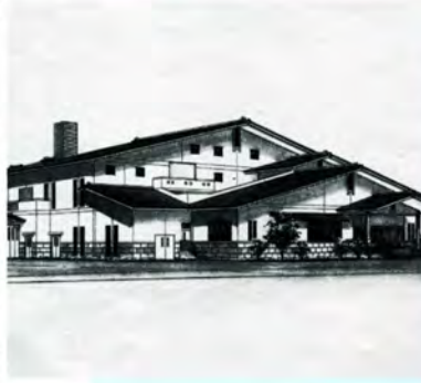
⑮ 平成12年完成に向け、 新し尿処理場を起工