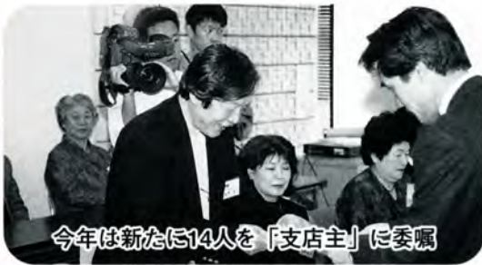
今年は新たに14人を「支店主」に委嘱