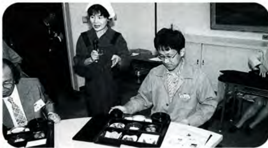
昼食はJA上庄の里芋料理