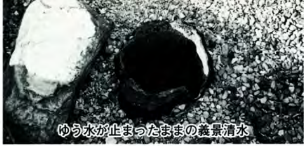
ゆわ水が止まったままの義景清水