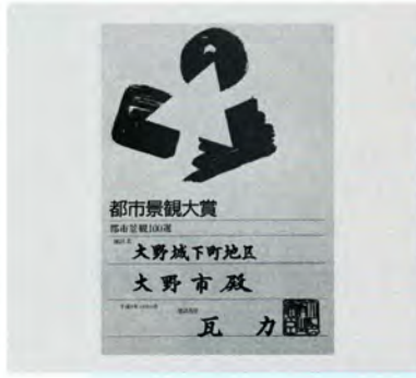
⑯ 市の城下町が都市景観 百選に選ばれる