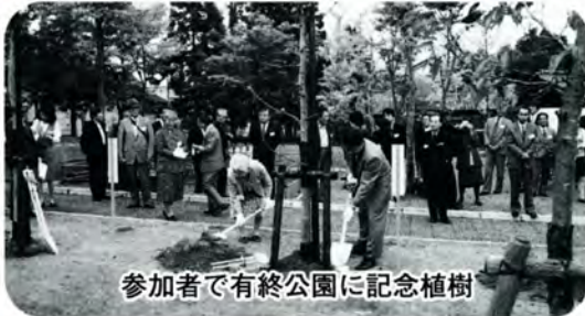
参加者で有終公園に記念植樹