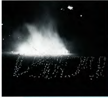
⑬ 城まつり30周年 ちようちんで人文字

各公民館・図書館・市民課の窓口にも投票用紙があるほか、下の用紙も切り取って使えます。 締め切り 12月18日（当日の消印有効） 発表 今月下旬に新聞などで 賞品 10項目の中者には、記念品を進呈。的中者が多数の場合は、抽選で10人とさせていただきます。