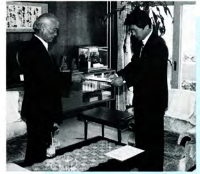
⑫ 情報公開懇話会が 提言書提出