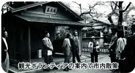
観光ボランティアの案内で市内散策