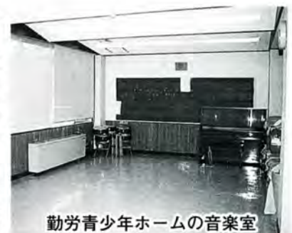
勤労青少年ホームの音楽室

勤労青少年ホームの音楽室の広さは、四十八平方メートルで、使用料は夜間ならいつでも八百円です。勤労青少年