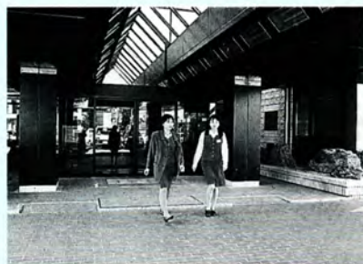
管理公社が置かれる有終会館