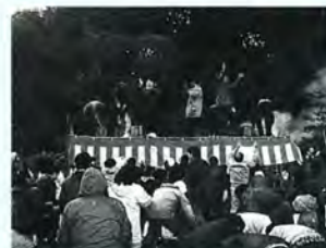
木本の初午だんごまき

手にメッセージを送る）などがあります。特に活発に意見交換されているのが、昨年の八月に開設した福祉関係のコーナー「魔法の杖」です。身体に障害を持つ人々からの質問や要望について、コーナーを見た人が必要な情報や意見などを提供しています。先の三国でのタンカー重油流出事故の際には、独自で情報コーナーを設けたほか、三国町社会福祉協議会が開設したインターネットの作成を代行し、全国に向けて被害状況や必要な物資、ボランティア活動などの情報を発信しました。おくえつネットでは