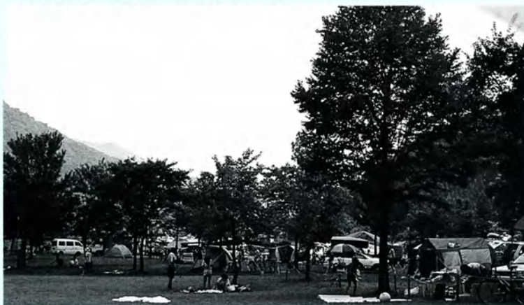
トイレが水洗化される 麻那姫湖青少年旅行村