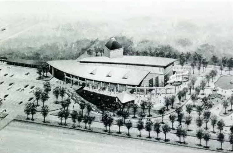
3年計画で建設される健康保養施設（完成予想図）