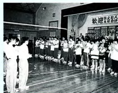
中学生による昨年の三石町訪問