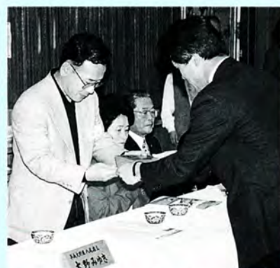
平成8年度平成大野屋初寄り合い