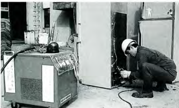
冷蔵庫からフロンガスを回収

施設は焼却処理設備、公害発生防止設備、不燃物処理設備、最終処分場(二時貯留場)に大きく分けられます。焼却設備では、二つの焼却炉が一日八時間で約三十五トンの処理を行っています。ごみを焼却するときには発生する煙やガスなどは、遠心分離式マルチサイクロンおよび電気集じ