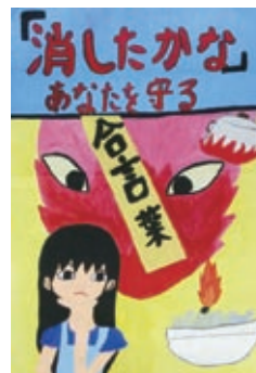
◀坂口友鶴さんの作品