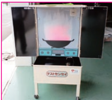
▲消火訓練装置 消火器使用法訓練装置で、防災訓練で使用します。

消防本部では、財団法人自治総合センター「宝くじ普及広報事業」の助成を受けて、備品を購入しました。