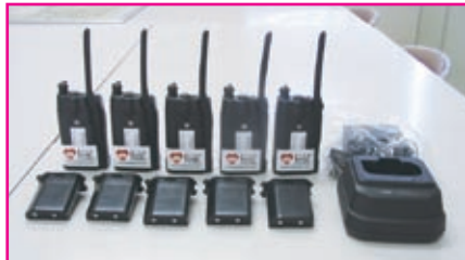
▲トランシーバー 5台