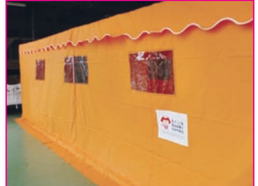
▲煙体験ハウス 濃煙体験ができる設備。防災訓練で使用します。