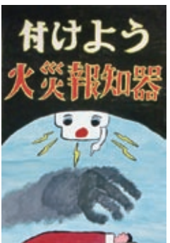
◀藤原貴弘さんの作品