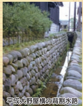
平成大野屋横の背割水路

長近公はその後、高山（岐阜県高山市）と上有知（岐阜県美濃市）で、城下町を造りましたが、それぞれ土地の地理的な特徴を利用して行っています。地下水を利用した水路の整備は、高山や上有知では見られない大野特有のものでした。