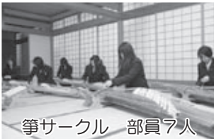
箏サークル 部員7人