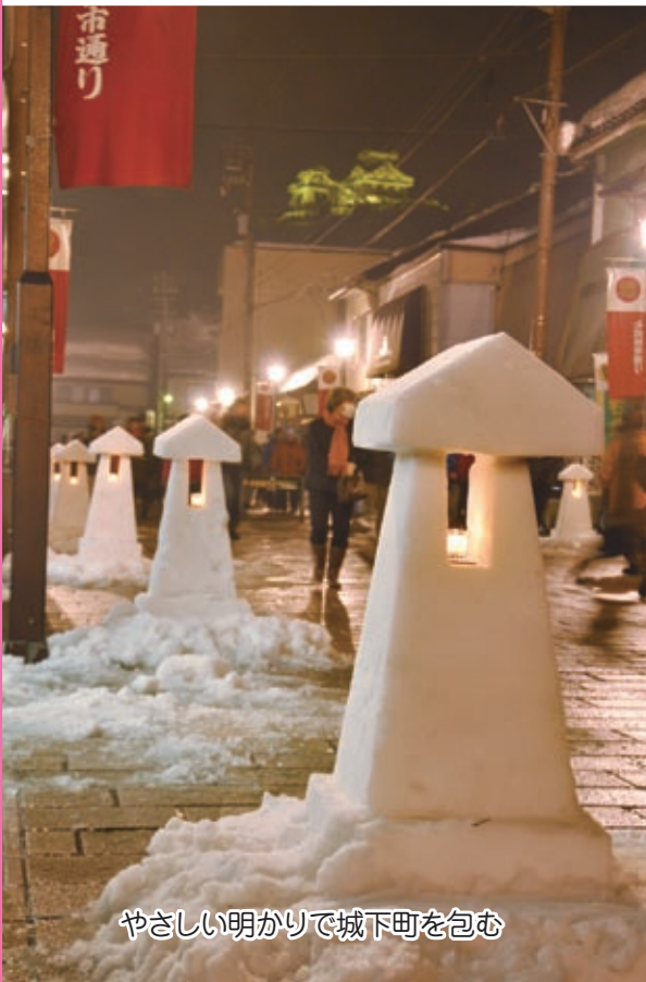
やさしい明かりで城下町を包む