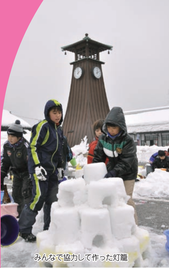
みんなで協力して作った灯籠