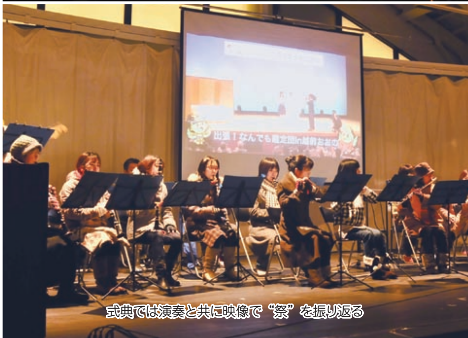
式典では演奏と共に映像で“祭”を振り返る