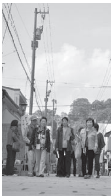
多くの観光客でにぎわう七間通り (10月16日 朝市開催時間中)

市が、さらに魅力あふれる観光地になることや、越前おおのの型農業を推進すること、市民が食についてより関心を高めることなどを目指して、3つの計画を改訂します。計画に皆さんの意見を反映させるため、素案を公開し意見を募集します。