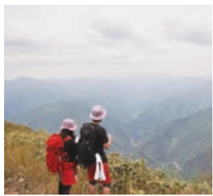
白山を眺める登山客

5月20日、荒島岳の山開きを取材するために荒島岳登山に挑戦しました。日ごろの運動不足と少しの後悔を感じながらも周囲の人たちに励まされ、何とか山頂に。山頂からは、今回設置された方位盤と同じように白山を見ることができ、しばらくの間山頂からの景色を楽しむことができました。翌日からの3日間、筋肉痛とお付き合いすることに・・・。