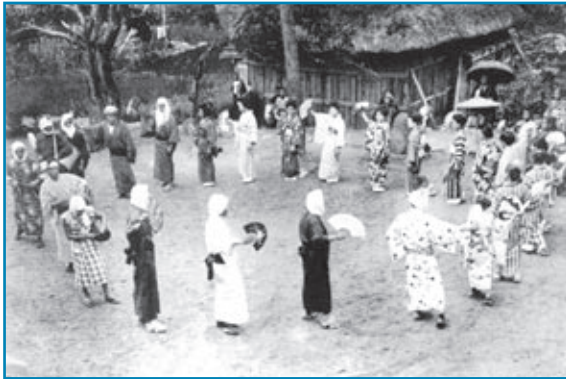
神子踊：昭和6年撮影