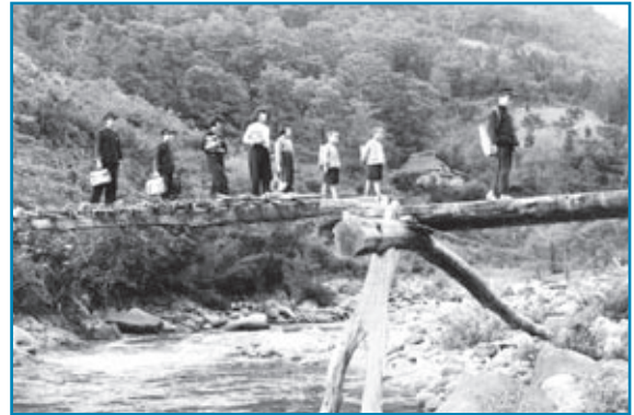
通学風景：昭和27年ごろ撮影

児童生徒が出作から登校するところを撮影したものです。一本丸太の橋を中学生が前後に付き、小学生を守っています。自家製のランドセルが印象的です。