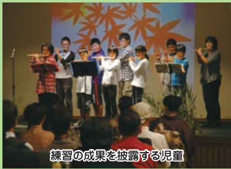
練習の成果を披露する児童

ゆかりも深き 九頭竜の あぎとの玉を ひろわんと つとう我等の 意気高く 立てし心は ゆめかえじ あさづく光 いやうけて 友に誠を つくしつづ 今日も学ばん 明日もまた 人の鑑と ならんまで