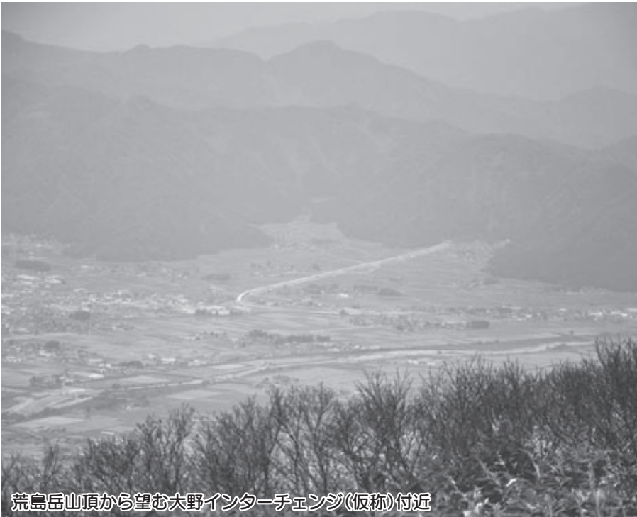
荒島岳山頂から望む大野インターチェンジ(仮称)付近