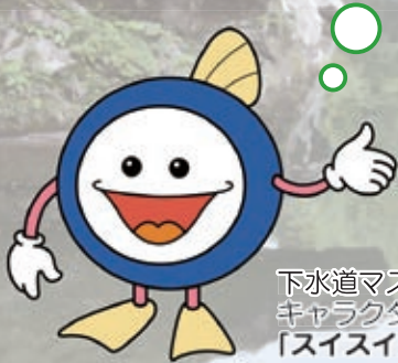
下水道マスコット キャラクター 「スイスイ」

川に住む微生物は、汚れの原因である有機物を食べて分解しているよ。これを川の「自浄作用」というんだ。でも、微生物が食べることでできる有機物の量には限りがあって、汚れを全部分解できないんだよ。少しでも水を汚さないようにすることが大切なんだ。川の上流の水はきれいでも、下流の水が汚れていることがあるのは、下流に川の自浄作用を超えた有機物が流れ込んでいるからなんだ。