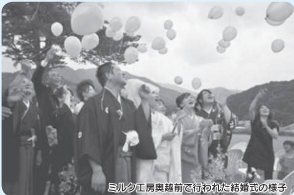
ミルク工房奥越前で行われた結婚式の様子

市内の会場で結婚式を挙げ、市内に住民登録があるカップルに、結婚式などに掛かった費用の一部を助成します。