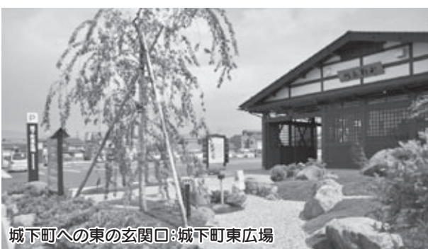
城下町東の玄関口:城下町東広場