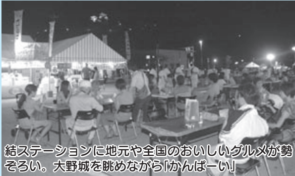
結ステーションに地元や全国のおいしいグルメが勢ぞろい。大野城を眺めながら「かんぱーい」