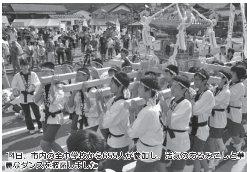
14日、市内の全中学校から655人が参加し、活気のあるみこしと華麗なダンスを披露しました