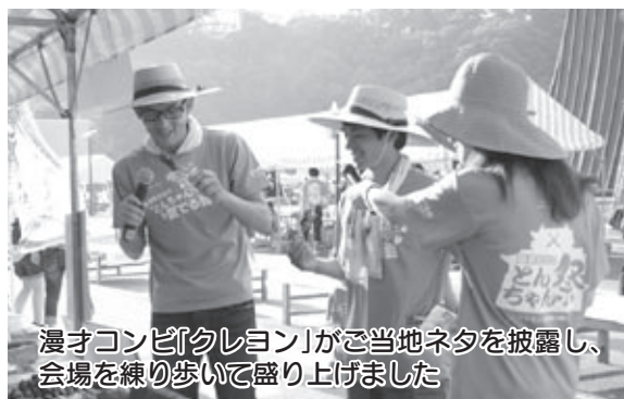
漫オコンビ「クレヨン」がご当地ネタを披露し、会場を練り歩いて盛り上げました