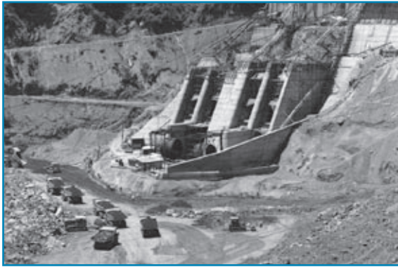
九頭竜ダム建設：昭和40年ごろ撮影

九頭竜ダムは昭和37年に建設を開始し、昭和43年に完成した岩石や土砂を積み重ねたロックフィル式のダムです。この写真は、現在は見ることでできない地下発電所の工事の様子を知ることができる貴重な一枚です。ダムの下にある30トンドンプと比べると、九頭竜ダムがいかに大きいかがよく分かります。