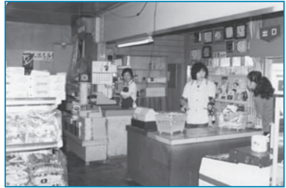
中竜鉱業所購買会：昭和40年ごろ撮影

昭和40年代の中竜鉱業所購買会のレジ付近の様子です。写真のように、籠に商品を入れてレジで精算するスーパーマーケット方式は、当時は珍しかったそうです。