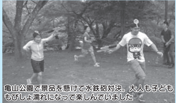
亀山公園で景品を懸けて水鉄砲対決。大人も子どももびしょ濡れになって楽しんでいました