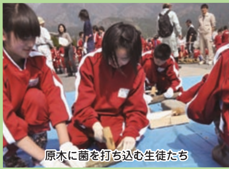
原木に菌を打ち込む生徒たち

陽明中学校は、昭和46年4月有終中学校区の一部と下庄中学校、乾側中学校を統合して誕生しました。「陽明」の名は、公募した名称から選ばれた、太陽の異称です。校歌は、昭和48年7月に作られています。 陽明中学校では、総合的な学習の時間の中で、環境について学ぶ「陽明の森プロジェクト」に取り組んでいます。第一期では、平成20年度から3年間、南六呂師の山林に広葉樹を植樹し、平成23年度からは、第二期の活動として、シイタケの原木栽培など森を守り、育てる活動に取り組んでいます。