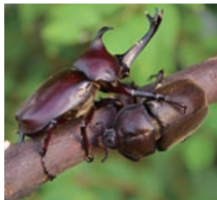
我が家のカブトムシ

夜のイベントが多かった8月のある日、取材の帰りに自宅近くの川に架かる橋でカブトムシを発見。次の夜から、息子と橋までの散歩が日課になりました。灯台下暗しでしたが、カブトムシのメッカのようので、毎晩、何組もの家族連れがやって来て、「こんばんは。カブトムシいましたか」と、貴重なコミュニケーションの場にもなりました。