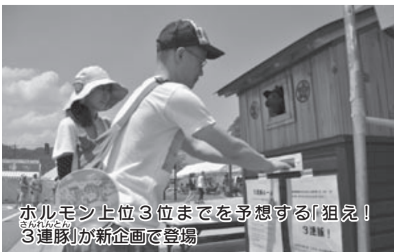
ホルモン上位3位までを予想する「狙え！3連隊」が新企画で登場