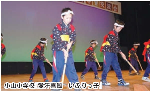
小山小学校「愛汗喜働 いふりっ子」