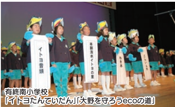
有終南小学校 「イトヨたんていだん」「大野を守るecoの道」