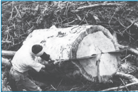
大木の切り出し作業：昭和30年代撮影

伐採したトチの大木を、木挽鋸(こびきのこ)を使って切断している様子を撮影したものです。この作業は大変なので、2人でひくのこぎりもありました。現在は、このようなこぎりの製造・販売はしていないそうです。