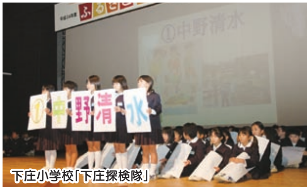
下庄小学校「下庄探検隊」