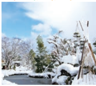
早かった雪シーズンの到来