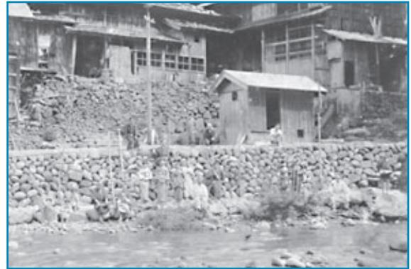
鳩ヶ湯：昭和8年撮影

負傷した山鳩が、傷を癒やしに沐浴(もくよく)にやってきたことから鳩ヶ湯の名があります。川べりに見える小屋では、当時、自家発電をしていたそうです。この鳩ヶ湯は今も、刈込池や赤兎山、荒島岳などへのハイキングや登山の基地になっています。