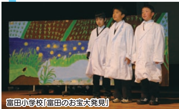
富田小学校「富田のお宝大発見」