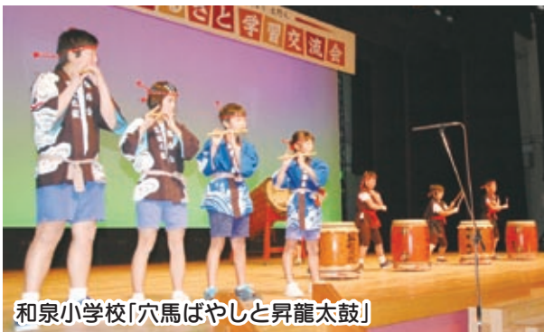
和泉小学校「穴馬ばやしと昇龍太鼓」

11月28日、文化会館で市内の小学校による、ふるさと学習交流会が開かれました。5小学校の3、4年生を中心とした児童が、地域の文化や自然、産業などの学習成果を発表しました。伝統の踊りや演奏を披露する場面もあり、発表が終わると集まった児童や保護者から大きな拍手が送られました。